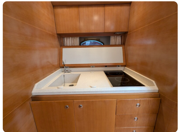
Sarnico Spider galley