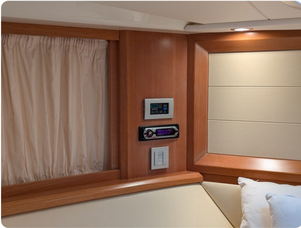
Sarnico Spider owner's cabin detail