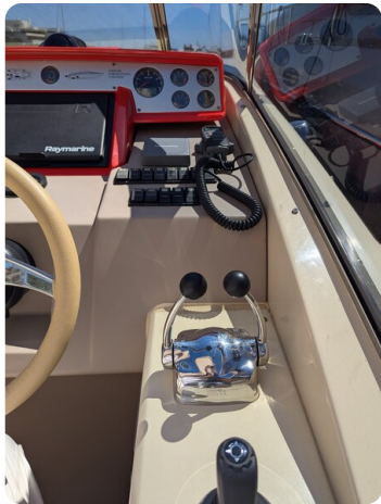
Sarnico Spider joystick