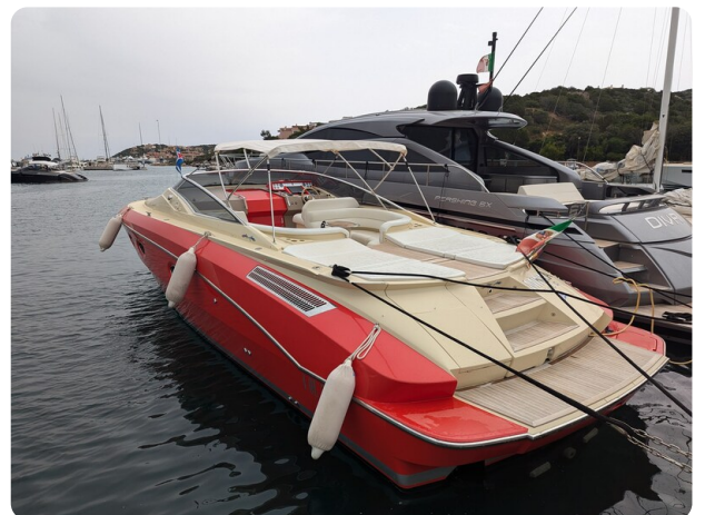
Sarnico Spider aft profile