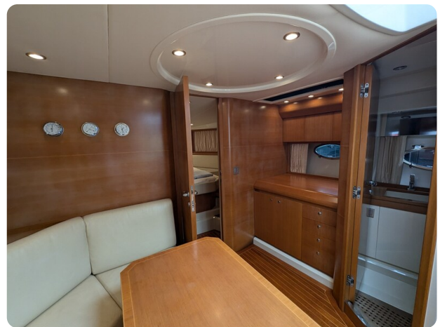
Sarnico Spider int details