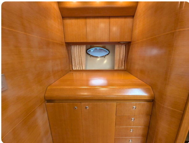
Sarnico Spider galley, closed