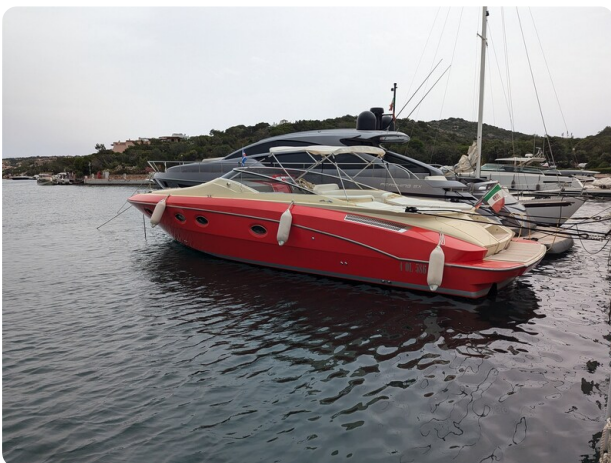
Sarnico Spider, profile