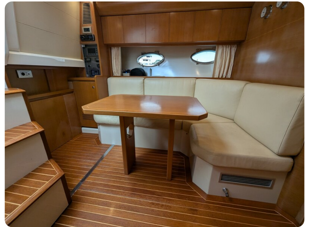
Sarnico Spider dinette