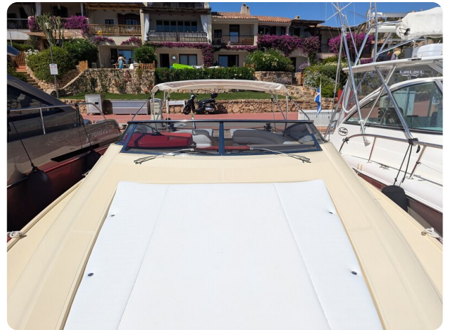
Sarnico Spider bow sunpad