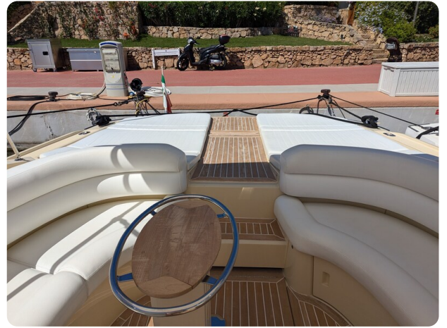
Sarnico Spider cockpit view