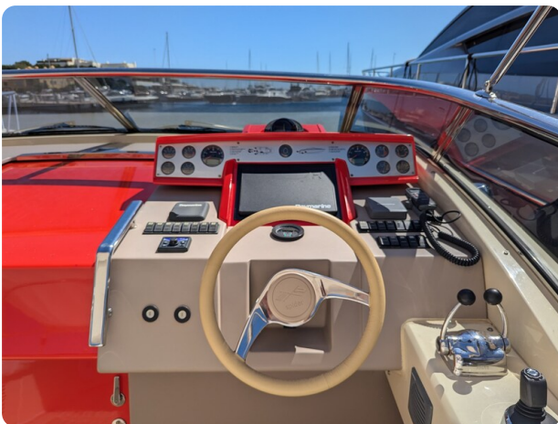
Sarnico Spider helm