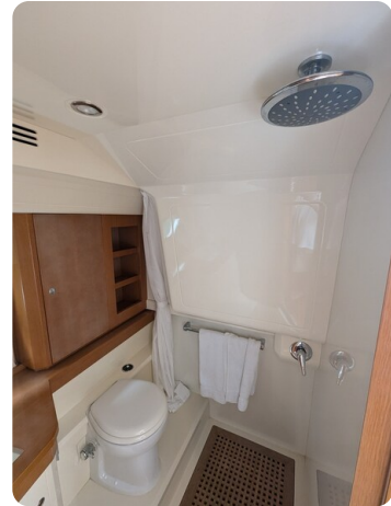
Sarnico Spider shower