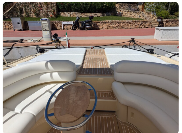
Sarnico Spider cockpit view