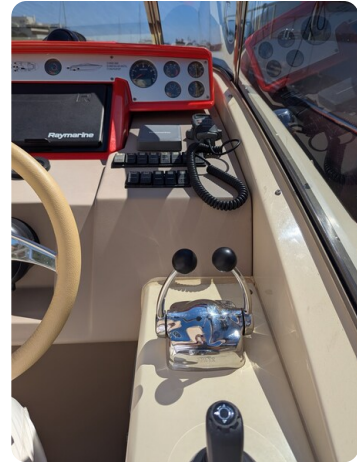
Sarnico Spider joystick