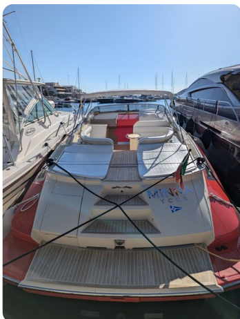
Sarnico Spider stern