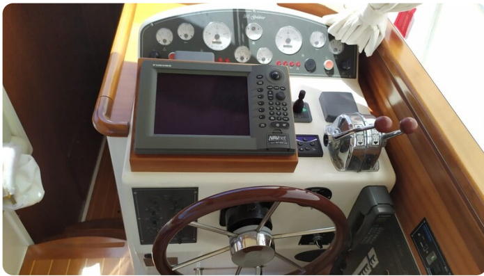
Goldstar 360 comandi