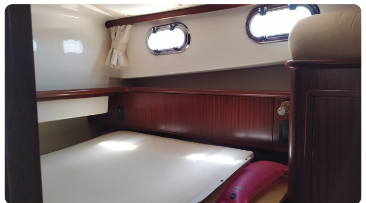
Goldstar 360 cabina armatoriale