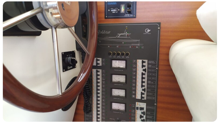
Goldstar 360 dettaglio