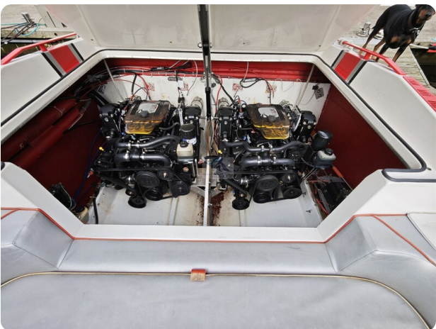
Cigarette 31 BULLET 32