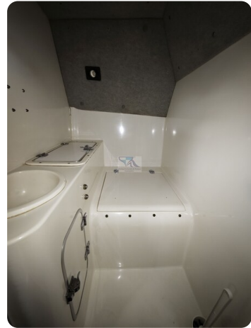
Cigarette 31 BULLET 27