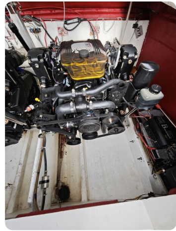
Cigarette 31 BULLET 36