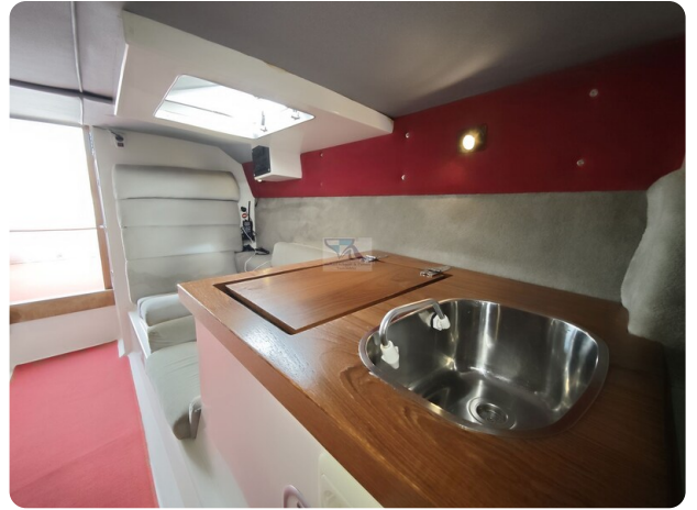
Cigarette 31 BULLET 24