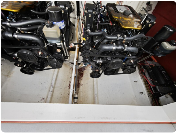
Cigarette 31 BULLET 35