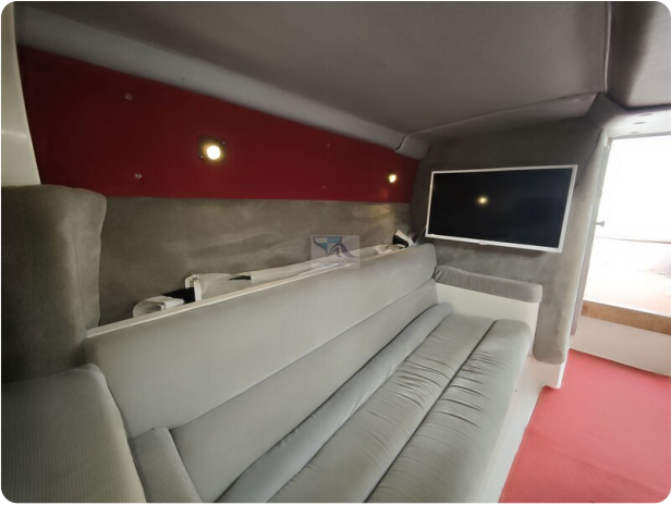
Cigarette 31 BULLET 22