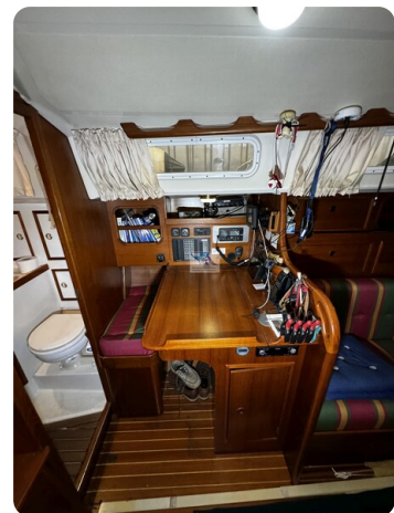
Contest 35S 9