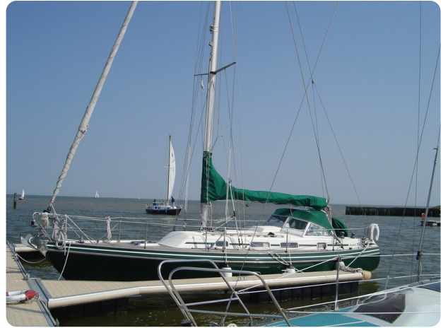
Contest 35S 40