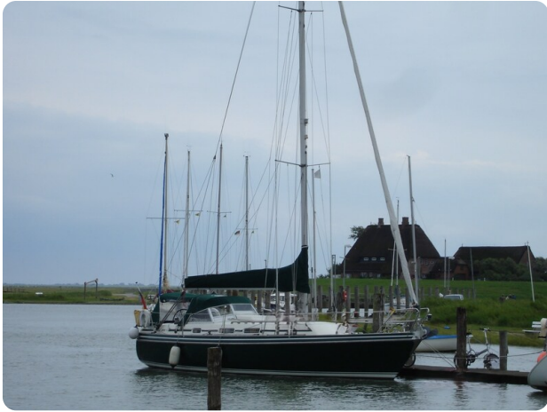
Contest 35S 43