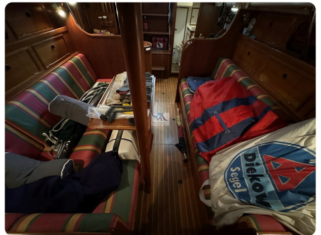
Contest 35S 28