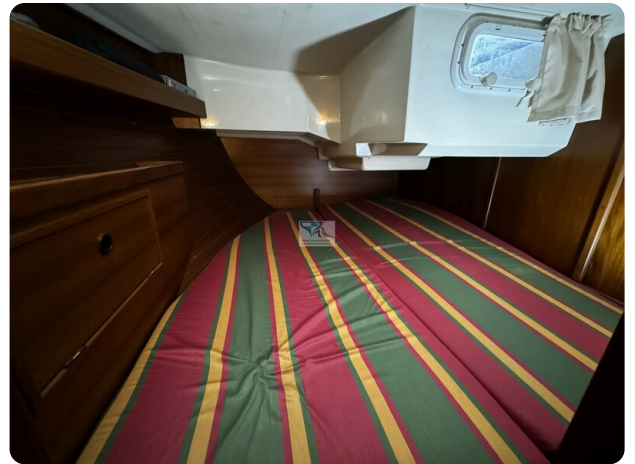
Contest 35S 1