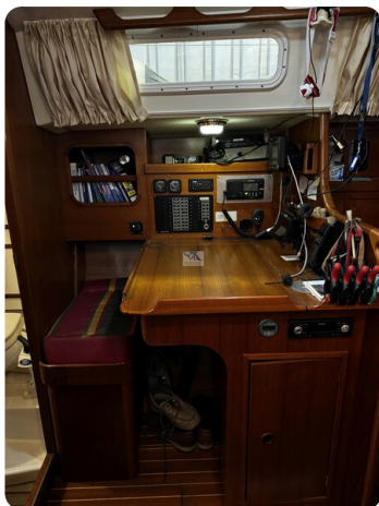
Contest 35S 8