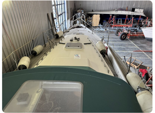
Contest 35S 31