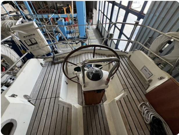
Contest 35S 34