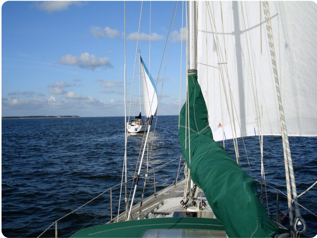
Contest 35S 41