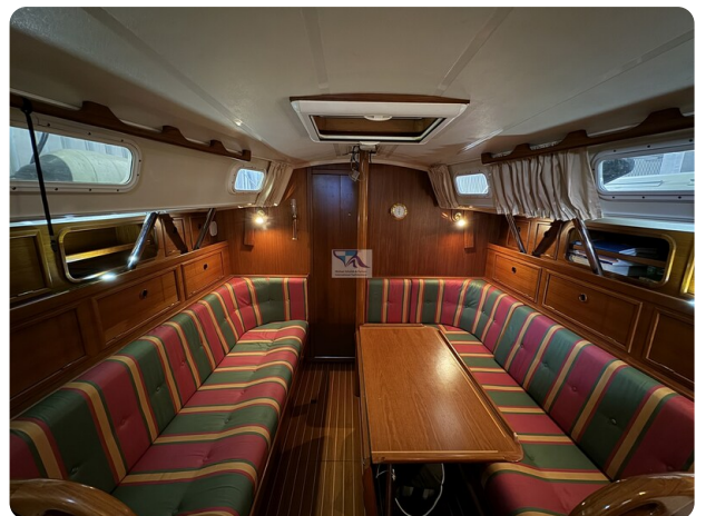
Contest 35S 20