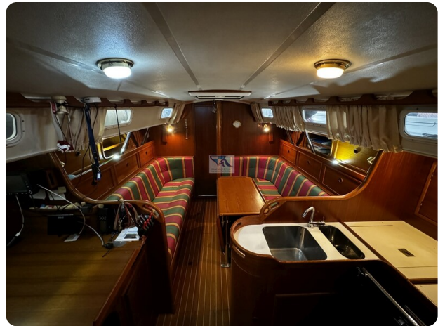
Contest 35S 13