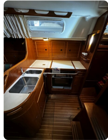
Contest 35S 5