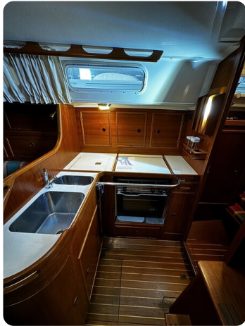
Contest 35S 4