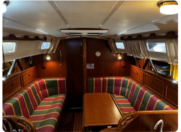
Contest 35S 16