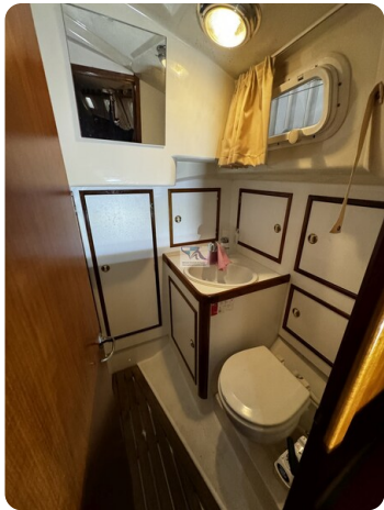
Contest 35S 11