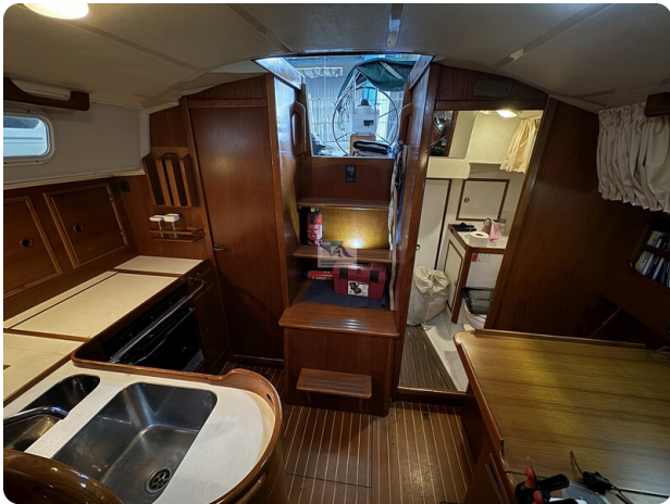
Contest 35S 22