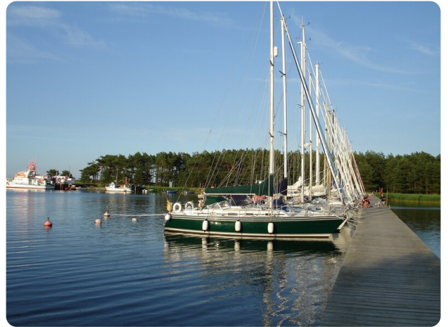
Contest 35S 42