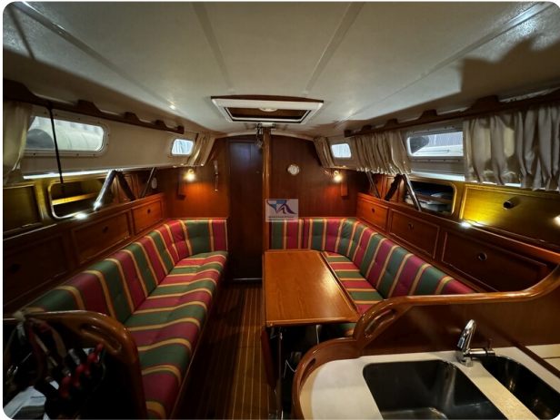
Contest 35S 14