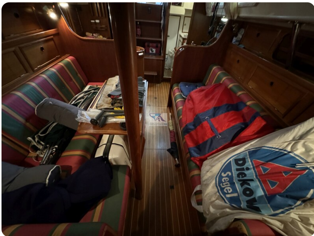
Contest 35S 27