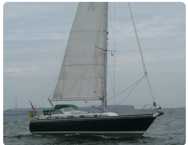
Contest 35S 44