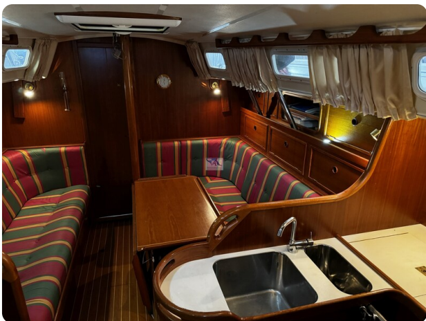
Contest 35S 17