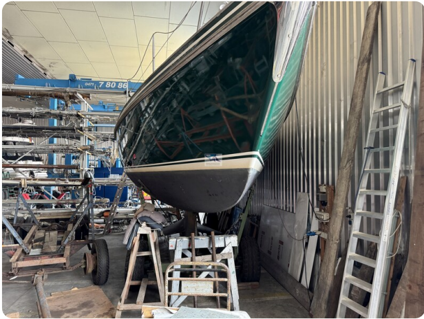
Contest 35S 38