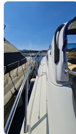
Cranchi 43 Mediterranée, sideways.jpg