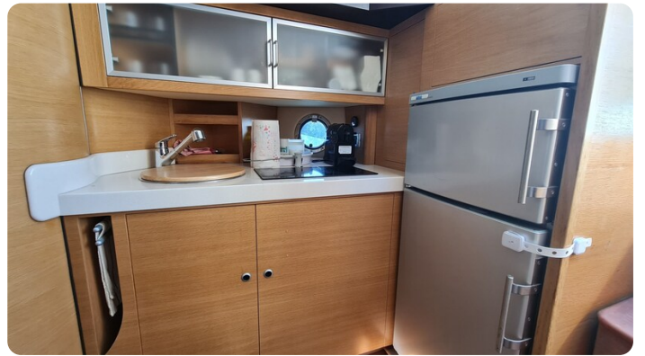
Cranchi 43 Méditerranée, galley.jpg