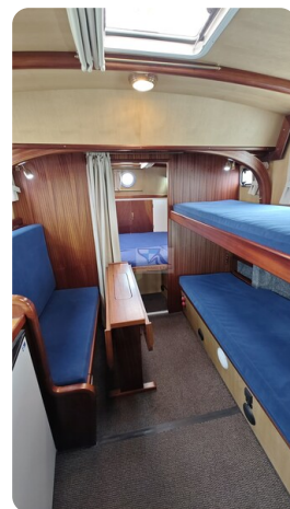
Spitzgatt Kutter LADY 70