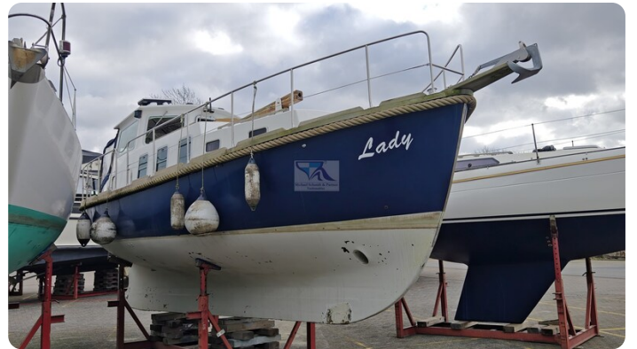
Spitzgatt Kutter LADY 7