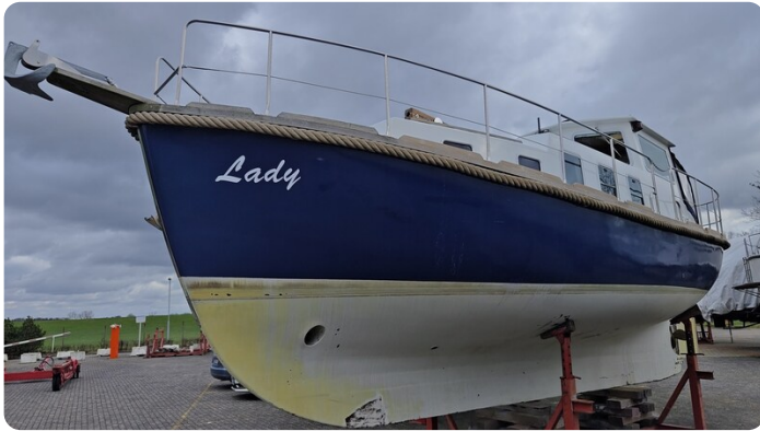
Spitzgatt Kutter LADY 1