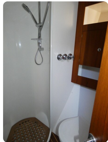
Van de Stadt 51 msp548133 22