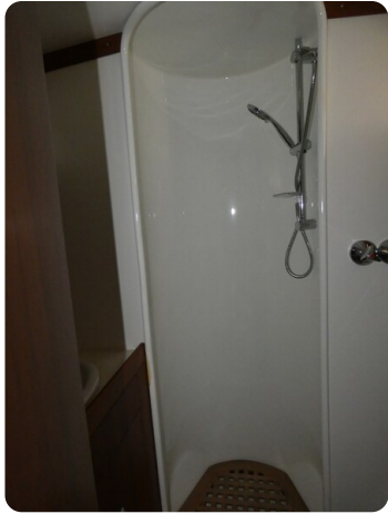
Van de Stadt 51 msp548133 19