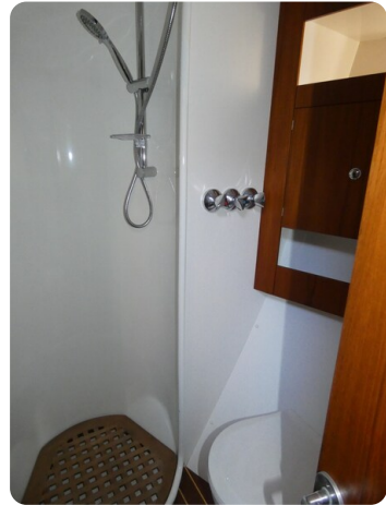
Van de Stadt 51 msp548133 22