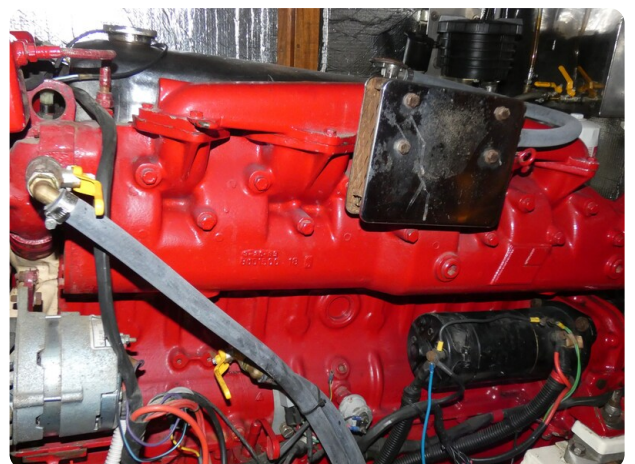
Van de Stadt 51 msp548133 24