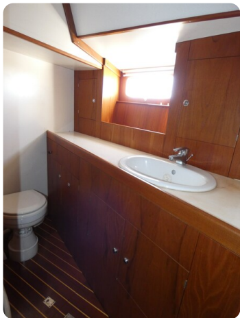
Van de Stadt 51 msp548133 21