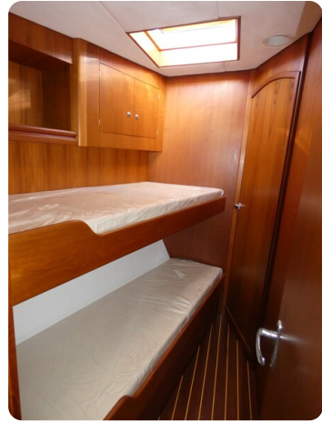
Van de Stadt 51 msp548133 20