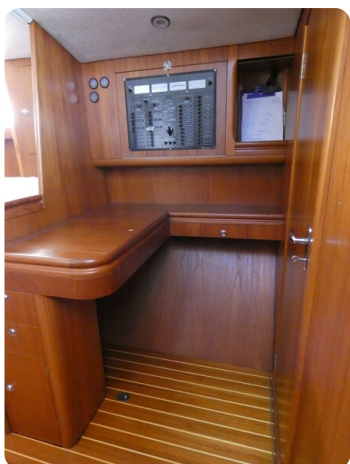
Van de Stadt 51 msp548133 23