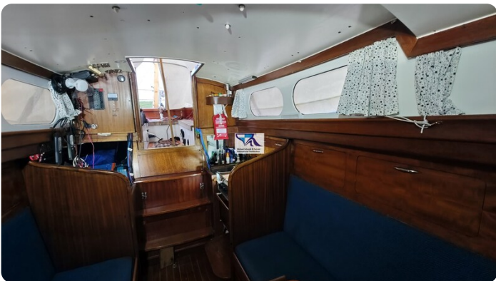
Marken II_msp797539 89