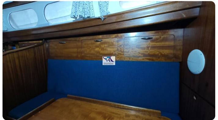
Marken II_msp797539 95