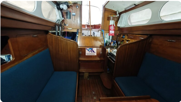
Marken II_msp797539 92