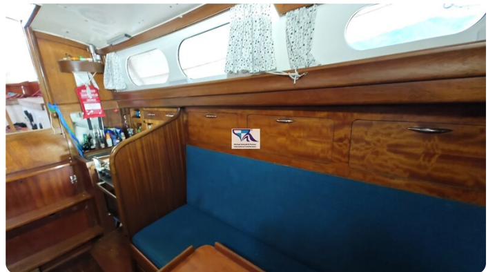
Marken II_msp797539 90