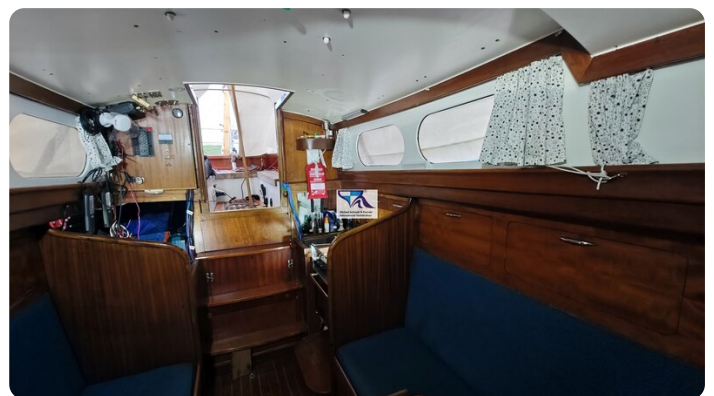
Marken II_msp797539 89