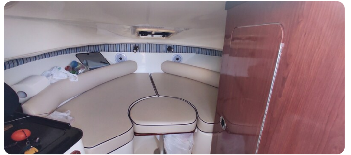
Edge Water 265 ex-5