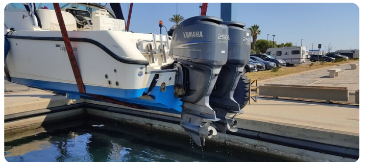
Edge Water 265 ex-7