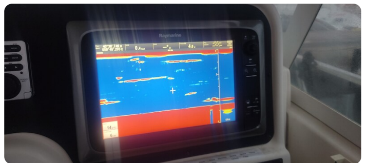
Edge Water 265 ex-13