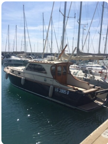
Liberty 35 Aft Profile Detail