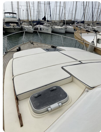
Liberty 35 Bow Sunpad