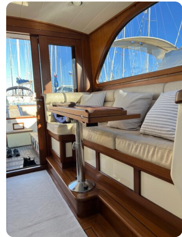
Liberty 35 dinette detail