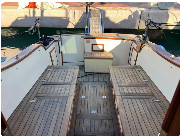
Liberty 35 cockpit view