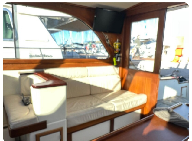
Liberty 35 salon detail