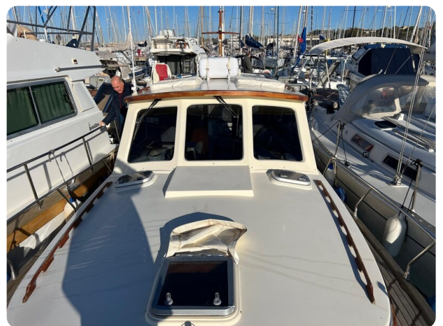
Liberty 35 fwd deck