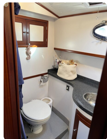
Liberty 35 head