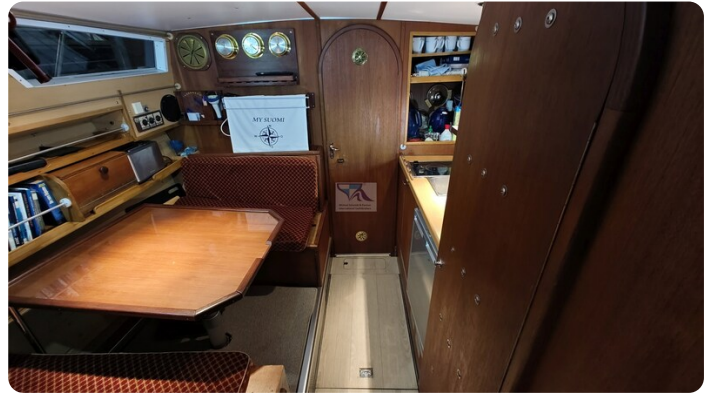
Reinke Tourina 10m_34