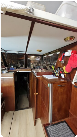
Reinke Tourina 10m_38