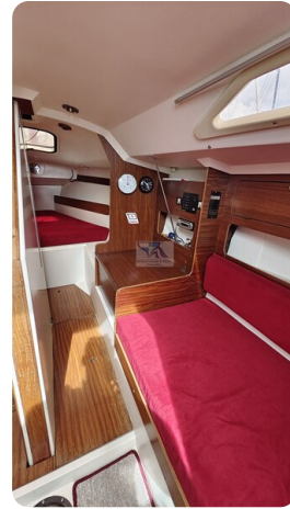
Etap 23i 7