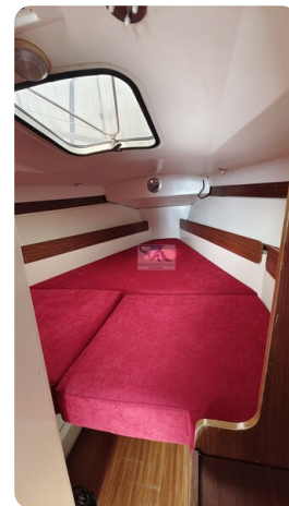
Etap 23i 1