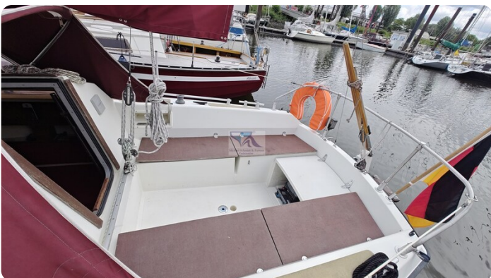
Etap 23i 25