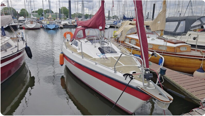
Etap 23i 22