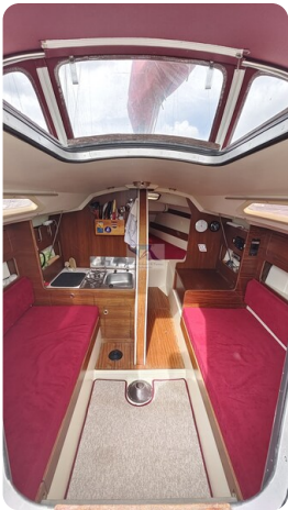
Etap 23i 15