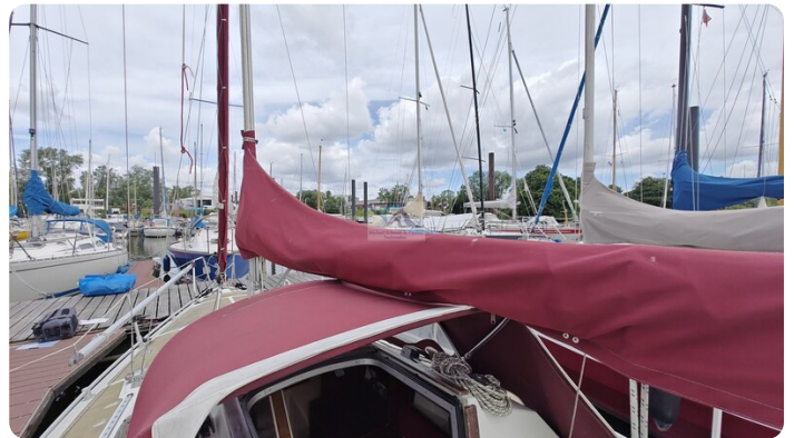
Etap 23i 29