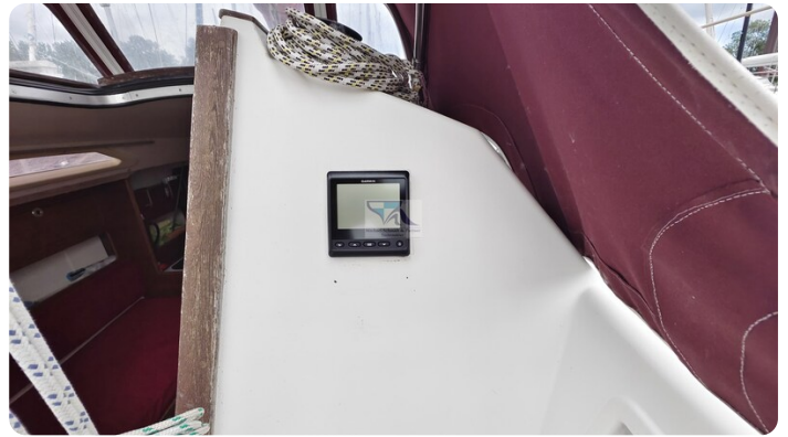
Etap 23i 28