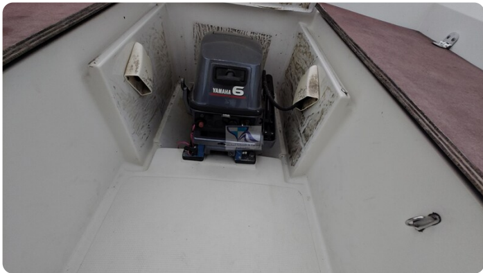
Etap 23i 27