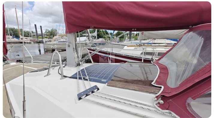
Etap 23i 24