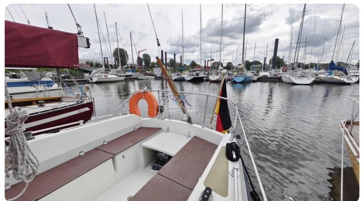
Etap 23i 26