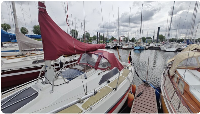
Etap 23i 23