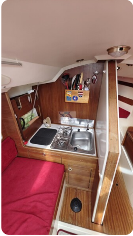
Etap 23i 9