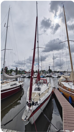
Etap 23i 17