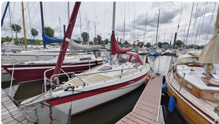
Etap 23i 20