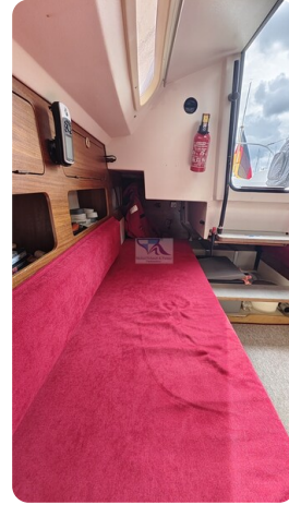
Etap 23i 11