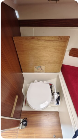
Etap 23i 3