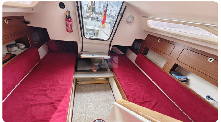
Etap 23i 13