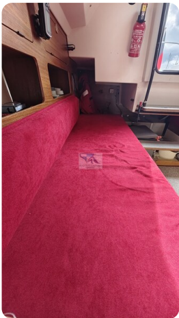
Etap 23i 12