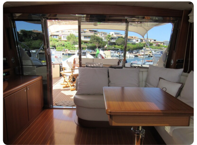
Franchini 55 Emozione, salon to aft