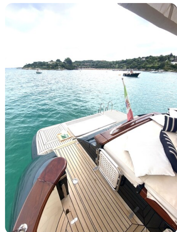
Franchini 55 Emozione