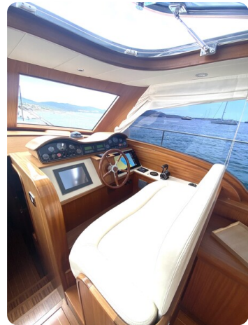
Franchini 55 Emozione