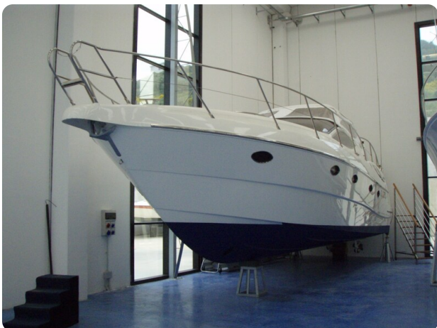
Gobbi 425 esterno (4)