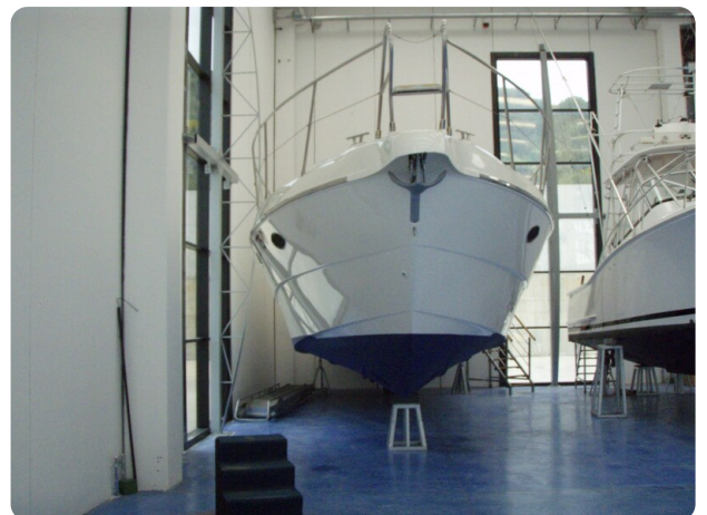
Gobbi 425 esterno (6)