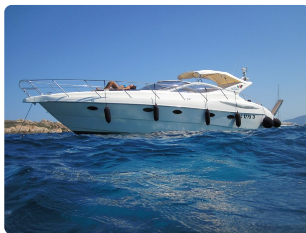
Gobbi 425 esterno (2)