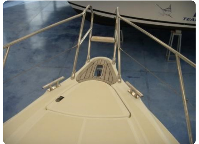
Gobbi 425 esterno (11)