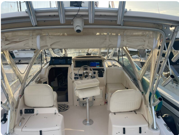
Grady White 305 express