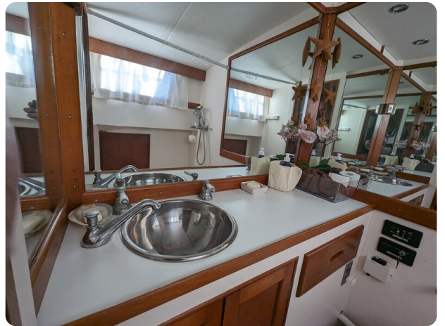
Grand Banks 42 Classic owner's bathroom