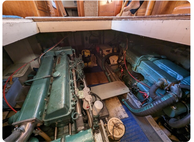
Grand Banks 42 Classic engine room