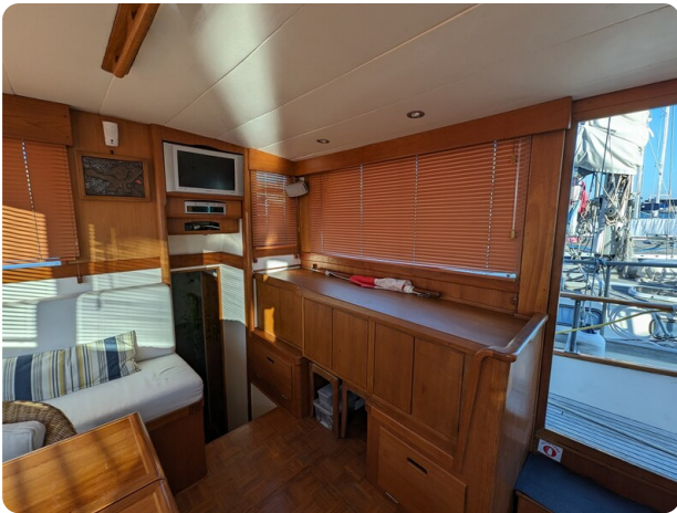
Grand Banks 42 Classic dinette detail