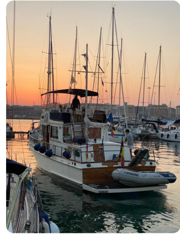
Grand Banks 42 sunset