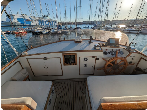
Grand Banks 42 Classic Fly helm station