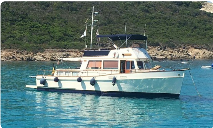
Grand Banks 42 Classic anchored