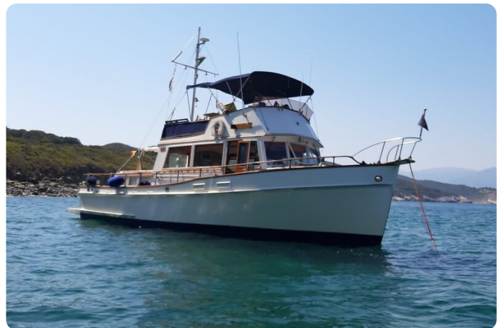
Grand Banks 42 Classic bow view