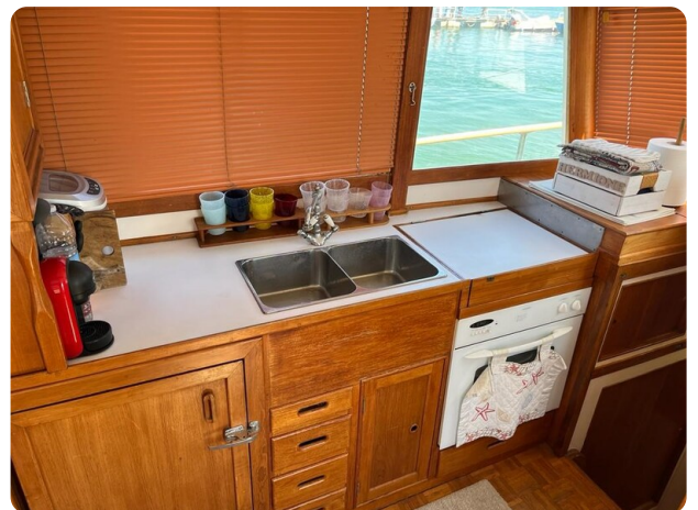
Grand Banksgalley 42 Classic