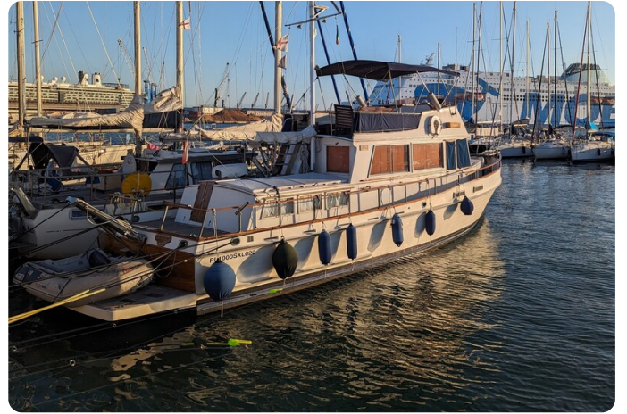
Grand Banks 42 Classic aft view