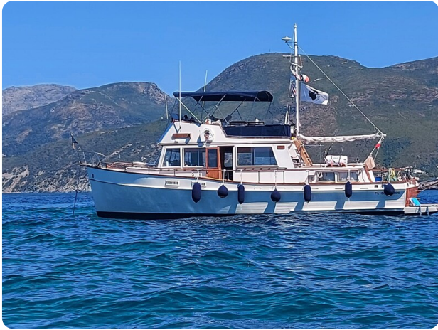
Grand Banks 42 Classic profile