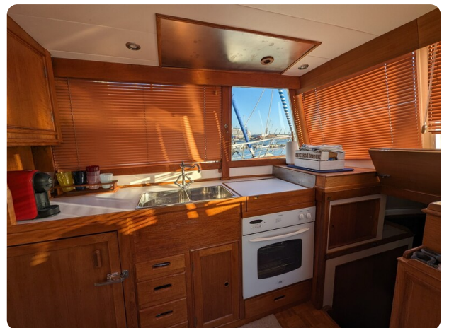
Grand Banks 42 Classic galley