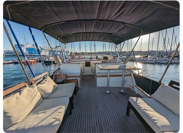
Grand Banks 42 Classic Fly dinette