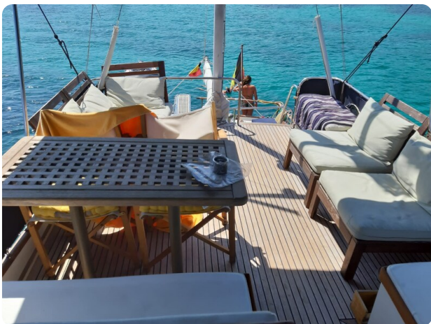
Grand Banks 42 Classic Fly view