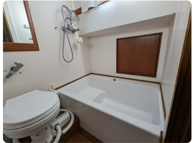
Grand Banks 42 Classic bathroom