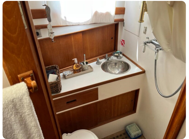
Grand Banks 42 Classic bathroom