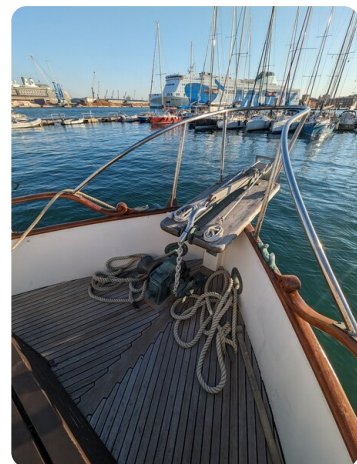
Grand Banks 42 Classic bow pulpit