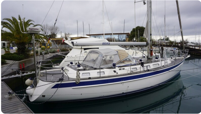
Hallberg Rassy 48 AURORA 1