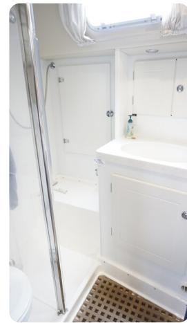
Hallberg Rassy 48 AURORA 34