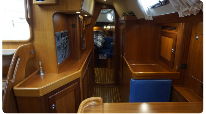
Hallberg Rassy 48 AURORA 28