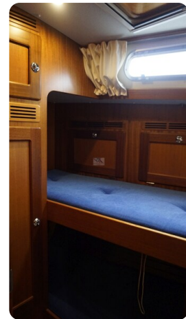
Hallberg Rassy 48 AURORA 42