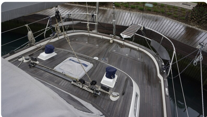
Hallberg Rassy 48 AURORA 11