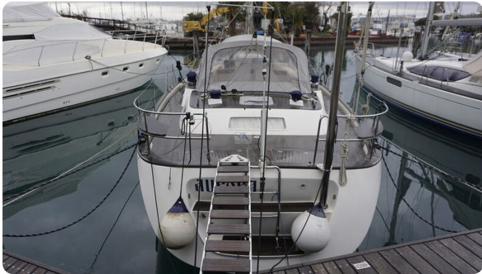
Hallberg Rassy 48 AURORA 3