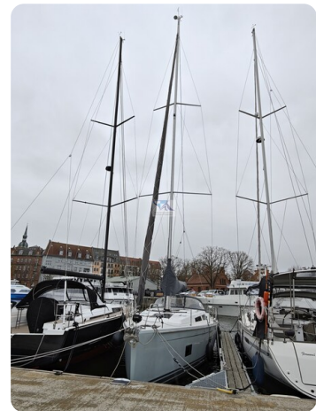
Hanse 418 EDGE 5