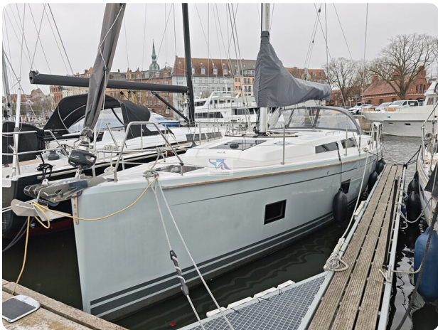
Hanse 418 EDGE 2