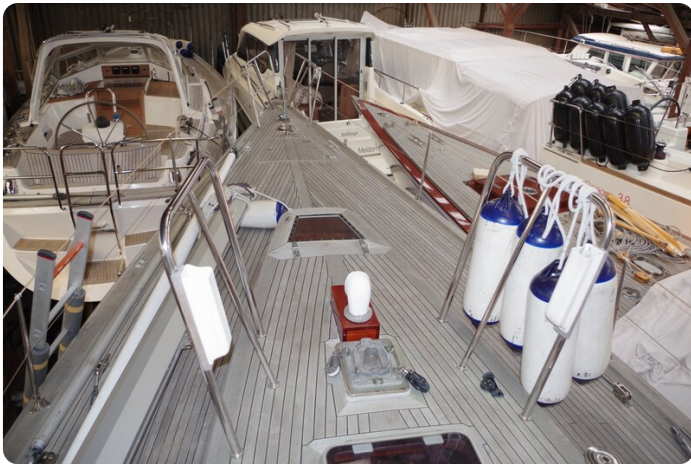
Hatecke 42 660249 20