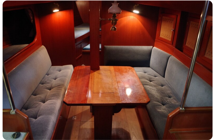
Hatecke 42 660249 108