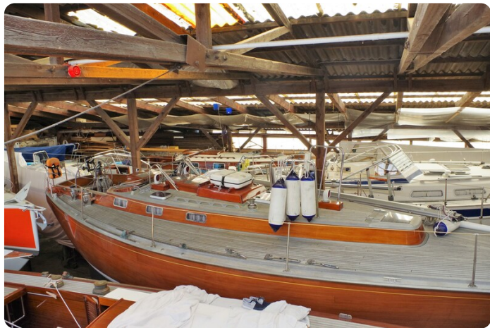
Hatecke 42 660249 133-1