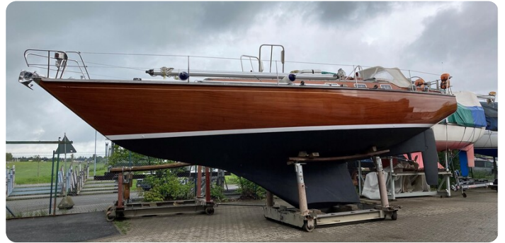
Hatecke 42 660249 1a