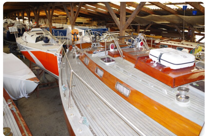
Hatecke 42 660249 139