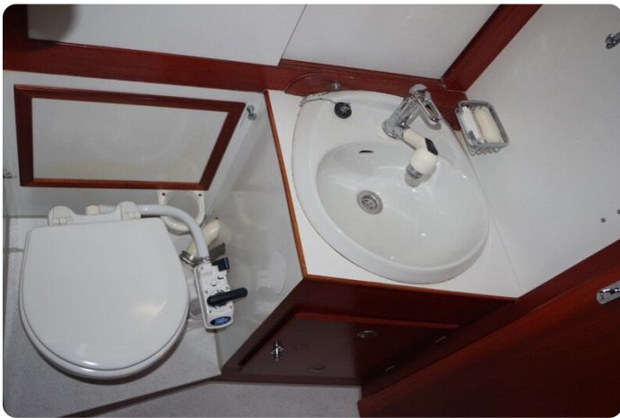
Hatecke 42 660249 42