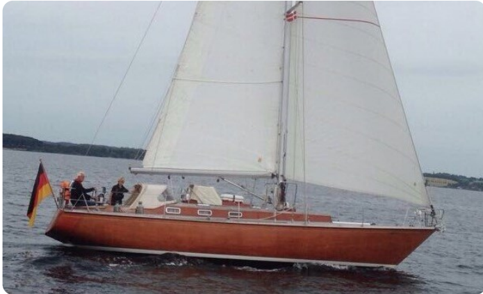
Hatecke 42 MELLUM