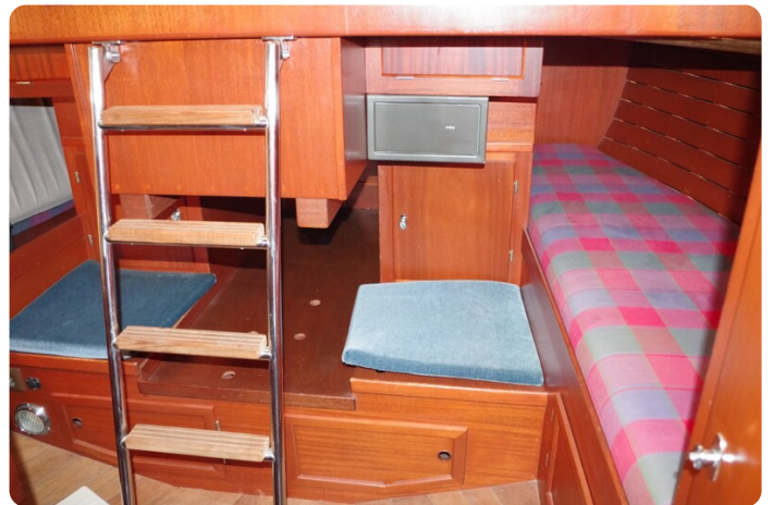
Hatecke 42 660249 116