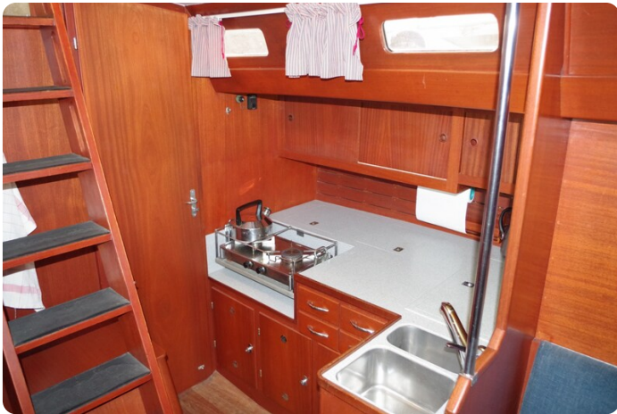
Hatecke 42 660249 49