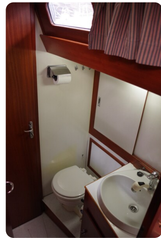
Hatecke 42 660249 46