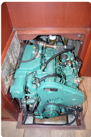
Hatecke 42 660249 100