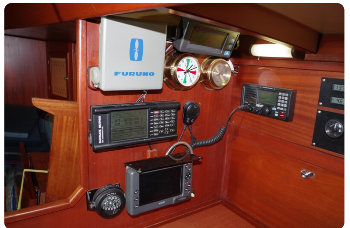
Hatecke 42 660249 69