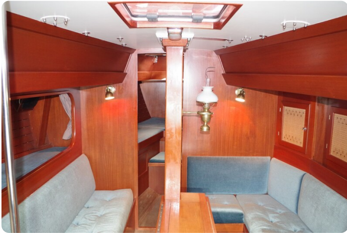
Hatecke 42 660249 92