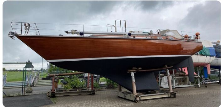
Hatecke 42 660249 1a