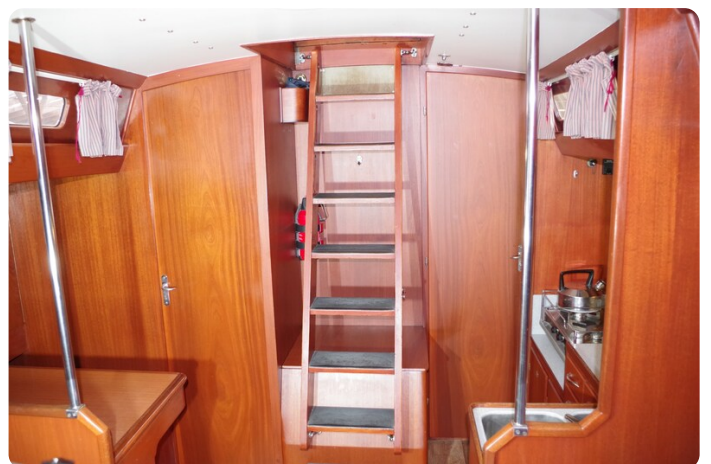
Hatecke 42 660249 77