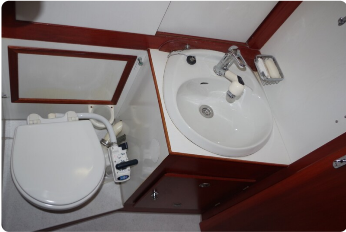
Hatecke 42 660249 42