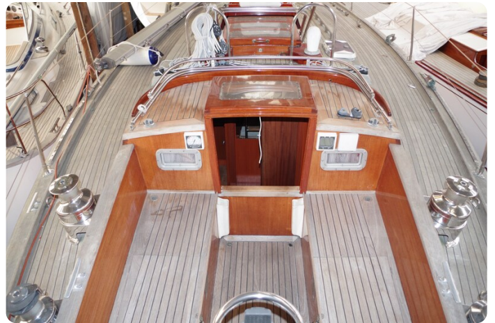
Hatecke 42 660249 15