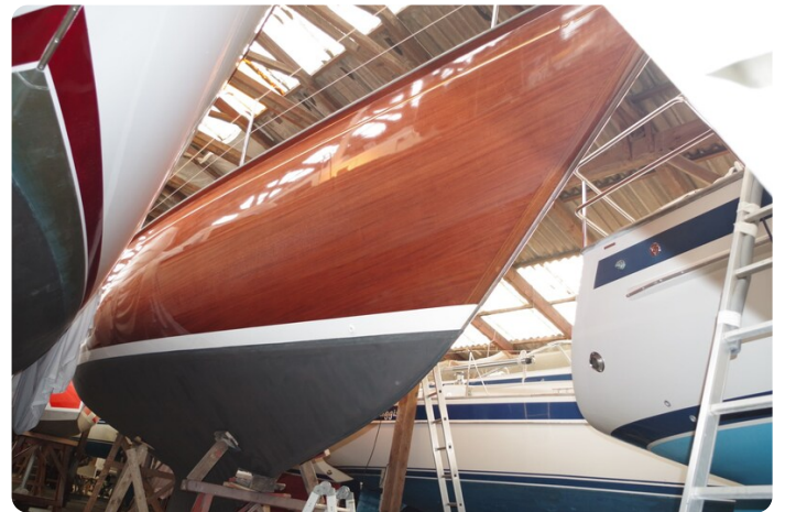
Hatecke 42 660249 8