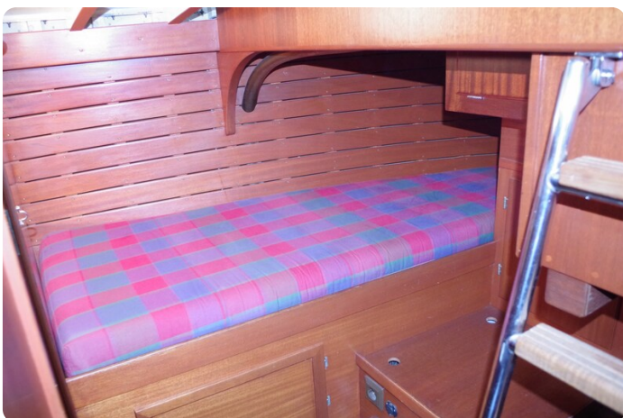
Hatecke 42 660249 110