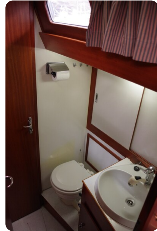
Hatecke 42 660249 46