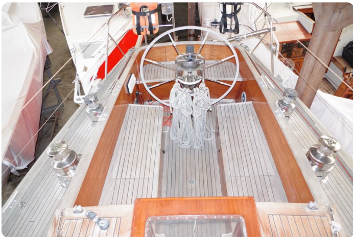
Hatecke 42 660249 35