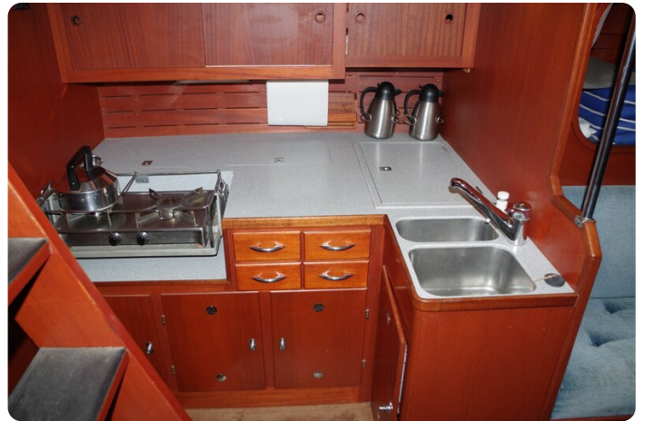
Hatecke 42 660249 50