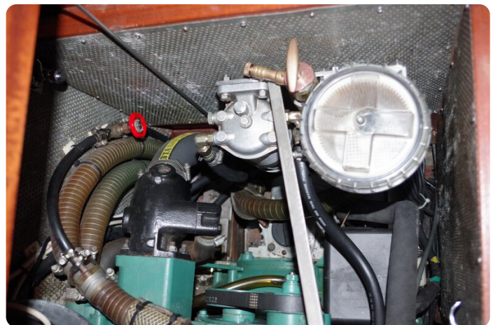
Hatecke 42 660249 125