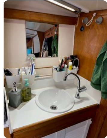
61 Koje Eigner WB