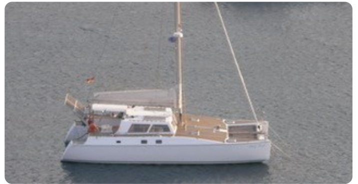
12 von der Seite