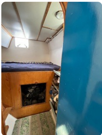
65 Koje Gäste achtern