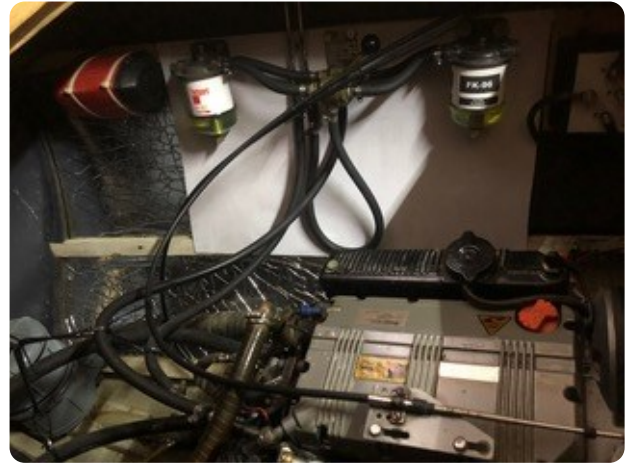
85 Motorraum Dieselfilter