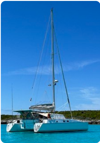
15 von hinten