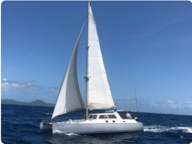
21 Gross und Genua