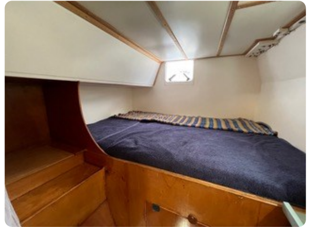
64 KojeGäste achtern