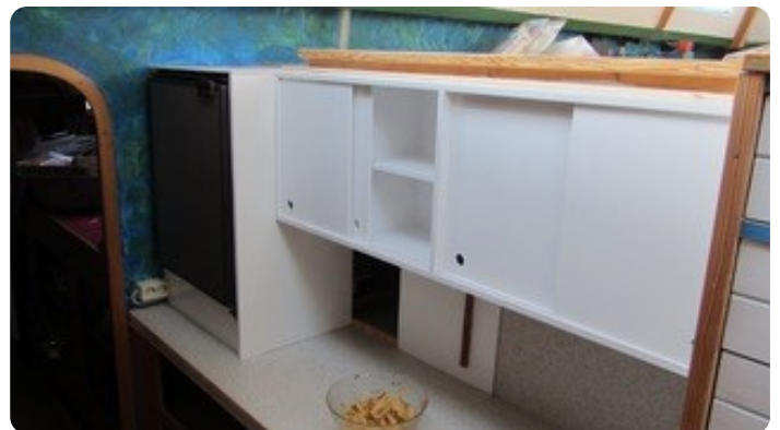
51 Küche BB