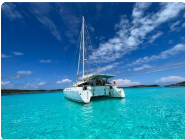
16 von hinten