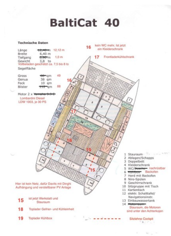
10 Grundriss original mit Änderungen