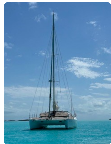
17 von vorne