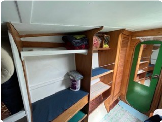
63 Koje Gäste