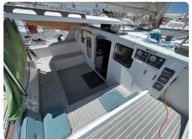
40 Cockpit Übersicht