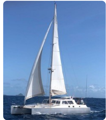
20 Gross und Genua