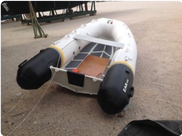
92 Dinghi 2019