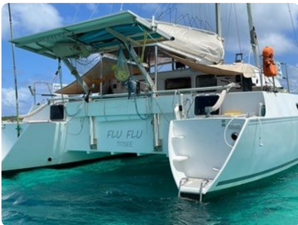
14 von hinten