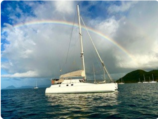
13 von der Seite