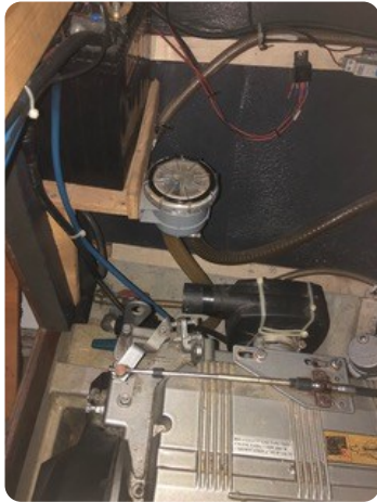
83 Motorraum Seewasserfilter