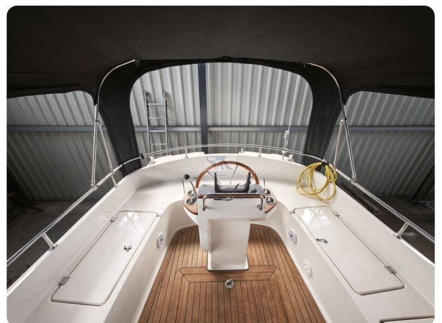
Inter cruiser 28 Cabrio ELVIRA 16