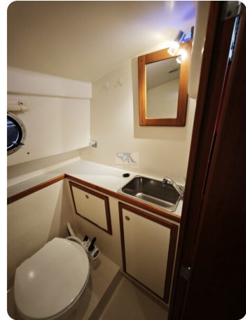
Intercruiser 28 Cabrio ELVIRA 50