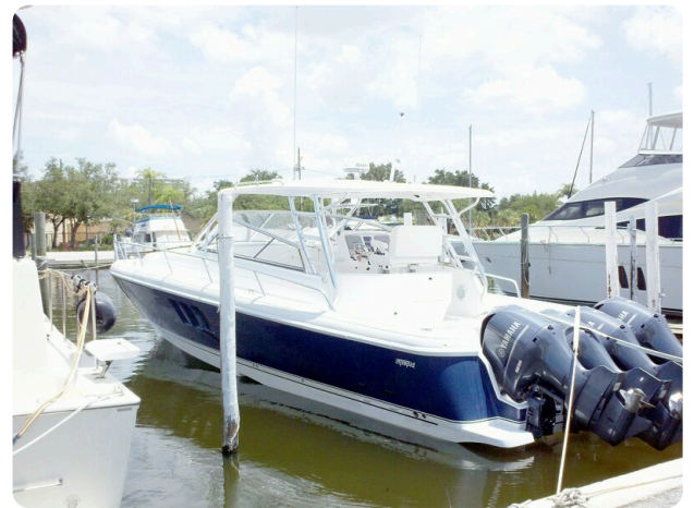
Intrepid 475 SY view