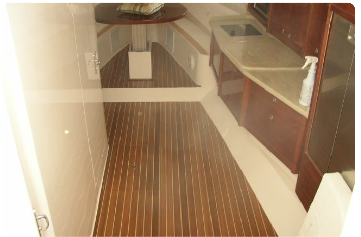
Intrepid 475 SY cabin