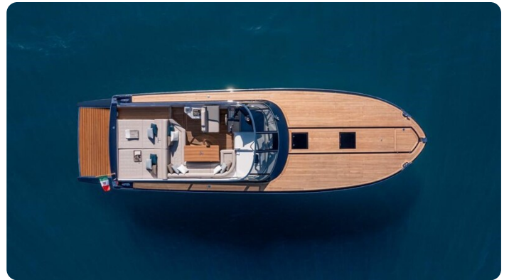
Itama 45RS aerial