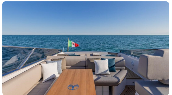
Itama 45RS cockpit dinette