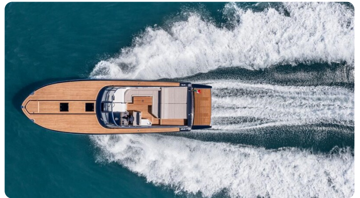
Itama 45RS running