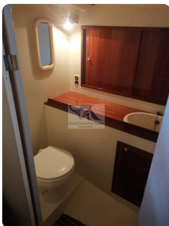
Kiel Legend 28 21