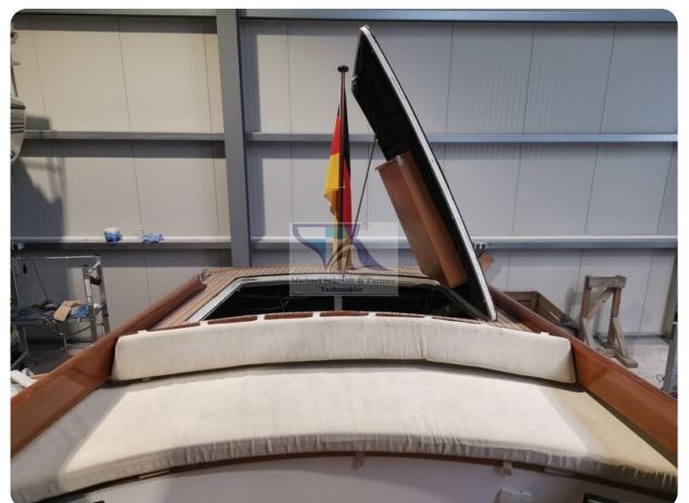
Kiel Legend 28 28