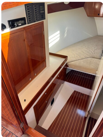
Kiel Legend 28 49