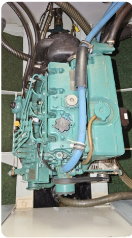
Linssen Grand Sturdy 29.9 2 - Kopie