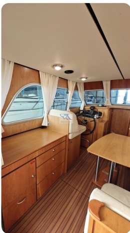
Linssen Grand Sturdy 29.9 21