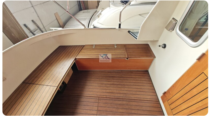
Linssen Grand Sturdy 29.9 53