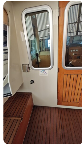
Linssen Grand Sturdy 29.9 56