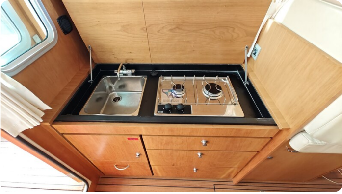
Linsse Grand Sturdy 29.9 16