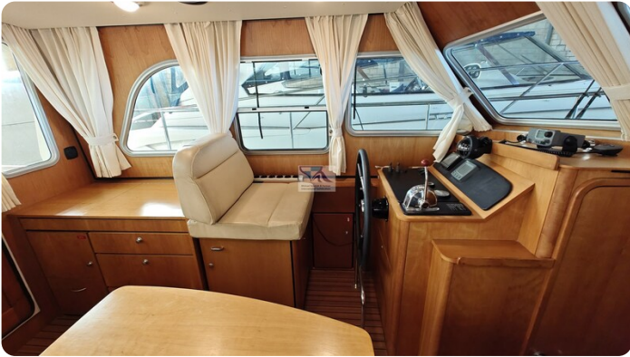
Linssen Grand Sturdy 29.9 26