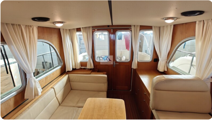
Linssen Grand Sturdy 29.9 24