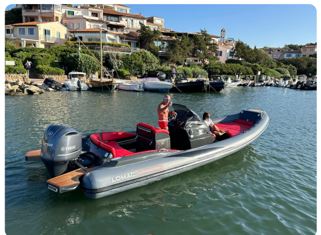
Lomac 7.50 Adrenalina aft view