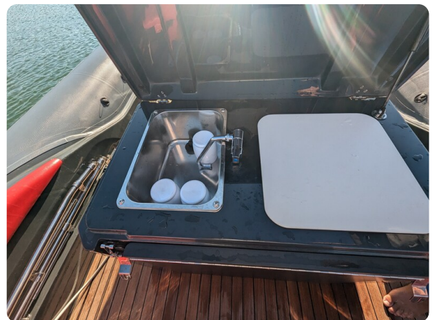
Lomac Adrenalina 7.5 sink