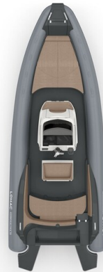
Lomac Adrenalina 7.5 layout