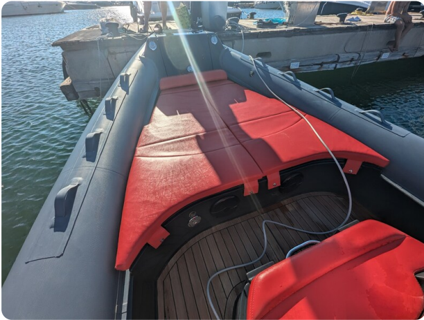
Lomac Adrenalina 7.5 bow sunpad