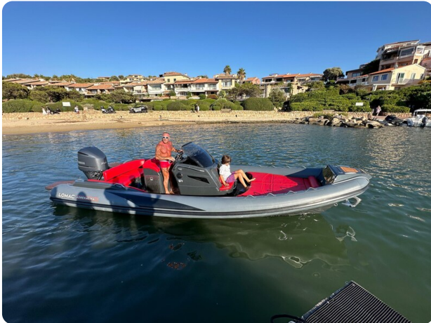
Lomac 7.50 Adrenalina view