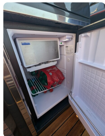
Lomac Adrenalina 7.5 fridge