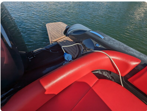
Lomac Adrenalina 7.5 shore power