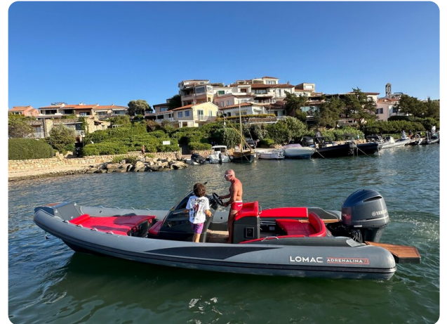
Lomac 7.50 Adrenalina profile 4