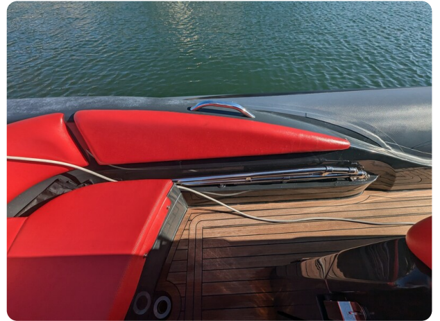
Lomac Adrenalina 7.5 detail