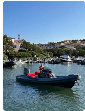
Lomac 7.50 Adrenalina bow