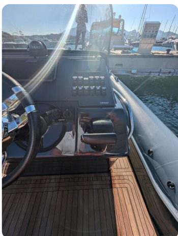
Lomac Adrenalina 7.5 console