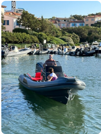
Lomac 7.50 Adrenalina bow view