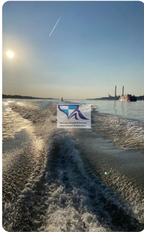
Marex 290 15