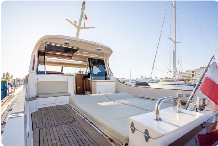
Dolphin 51 cockpit