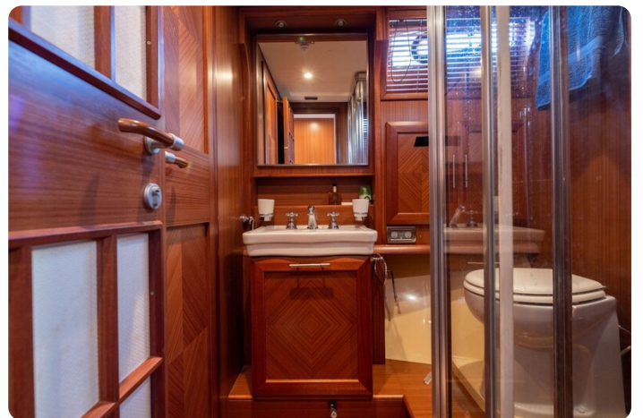
Dolphin 51 bathroom