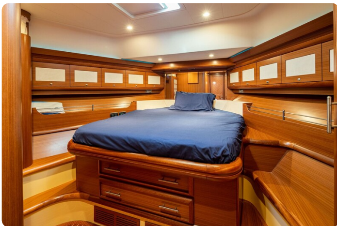
Dolphin 51 Vip cabin