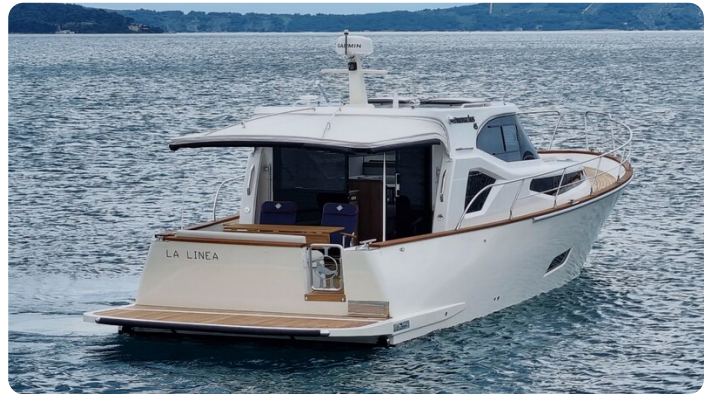
Copy of Back side