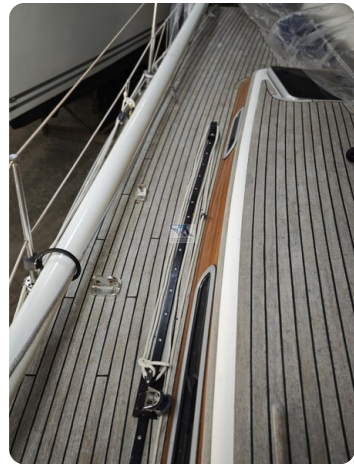
Nordborg 40 16