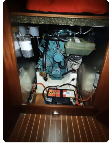
Nordborg 40 61