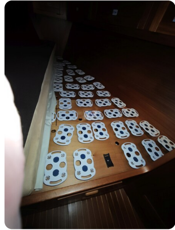
Nordborg 40 66