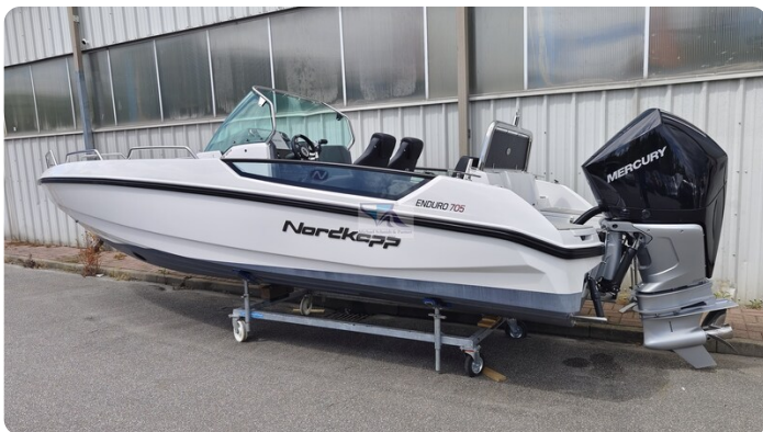
Nordkapp 705 50