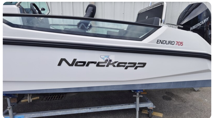
Nordkapp 705 51