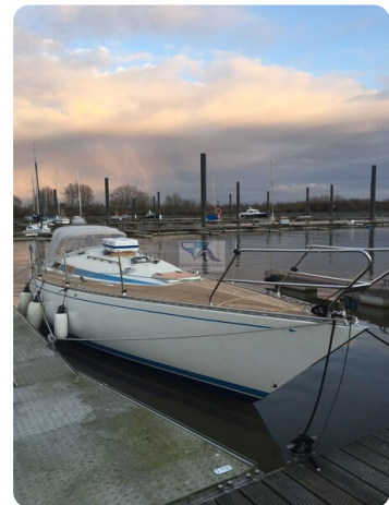
Avance 36 dL msp33