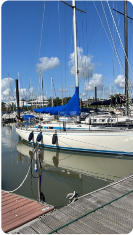
Avance 36 dL msp1