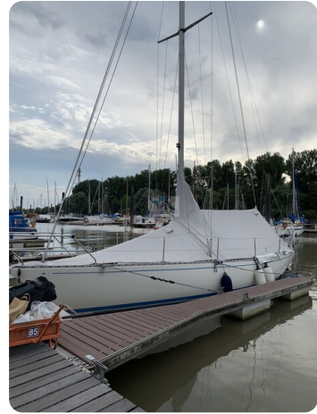
Avance 36 dL msp35