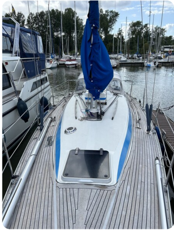
Avance 36 dL msp11