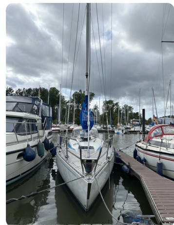
Avance 36 dL msp4