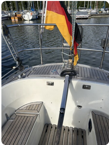
Avance 36 dL msp25