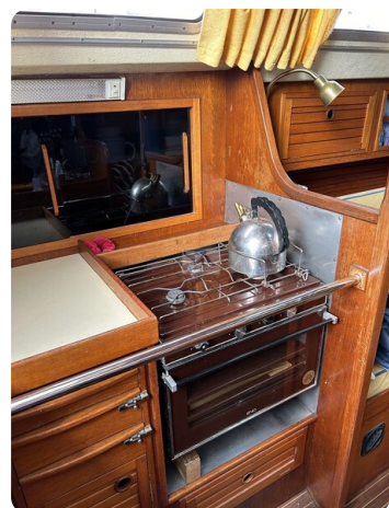
Avance 36 dL msp16