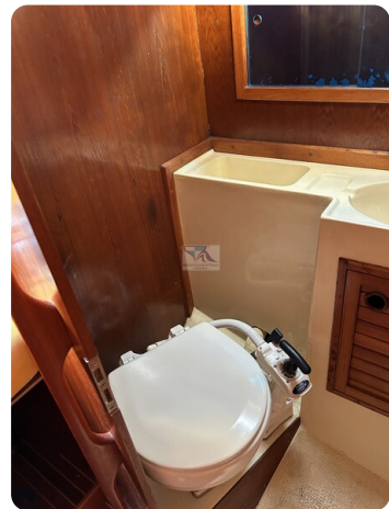
Avance 36 dL msp21