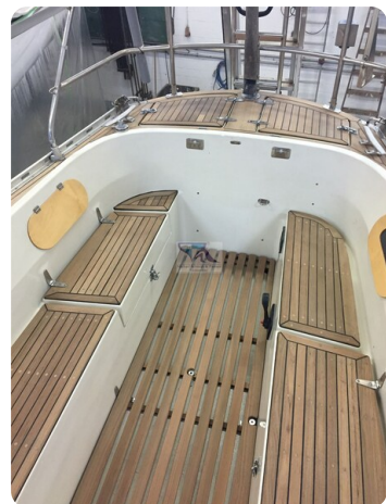
Avance 36 dL msp32