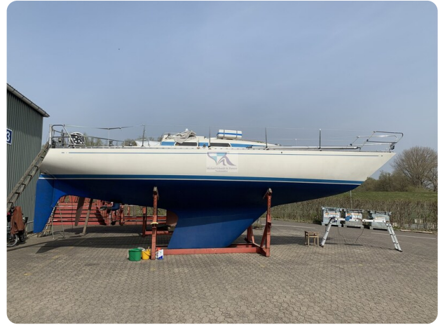
Avance 36 dL msp39