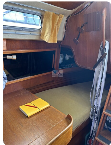
Avance 36 dL msp14