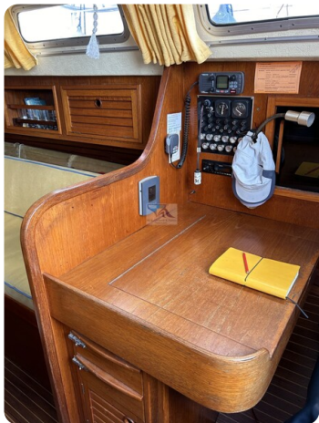
Avance 36 dL msp13