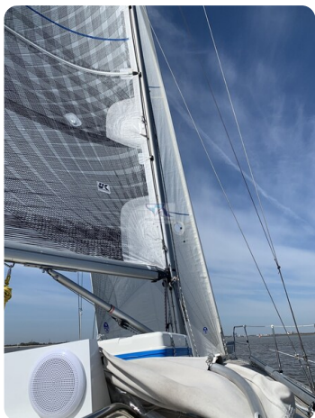
Avance 36 dL msp36