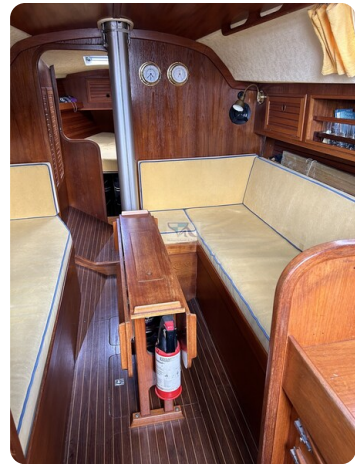
Avance 36 dL msp12