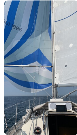
Avance 36 dL msp37