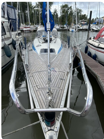
Avance 36 dL msp3