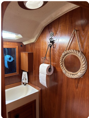
Avance 36 dL msp20