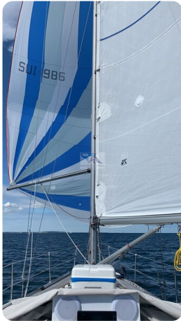
Avance 36 dL msp38