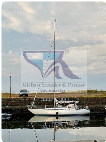
Avance 36 dL msp2