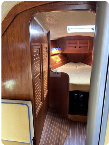
Avance 36 dL msp18