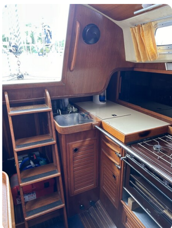
Avance 36 dL msp15