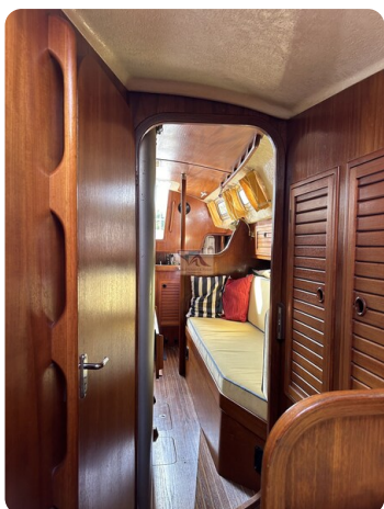
Avance 36 dL msp24