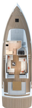
Pardo GT52 main deck