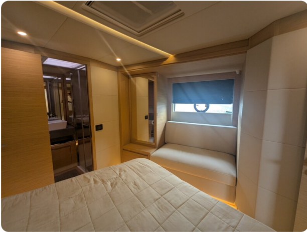
{1} Owner's cabin detail