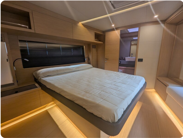
Pardo GT52 owner's cabin