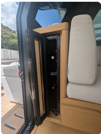
Pardo GT52 wine cooler