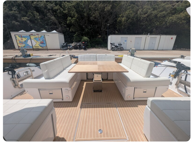
Pardo GT52 cockpit dinette convertible