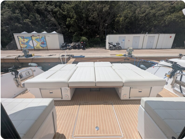
Pardo GT52 aft sunpad