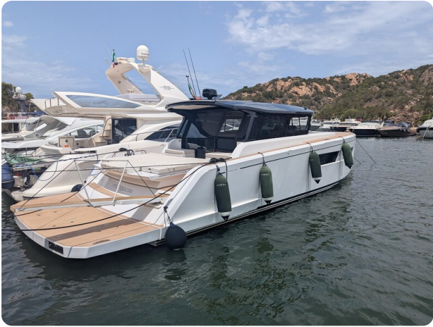
Pardo GT52 aft profile