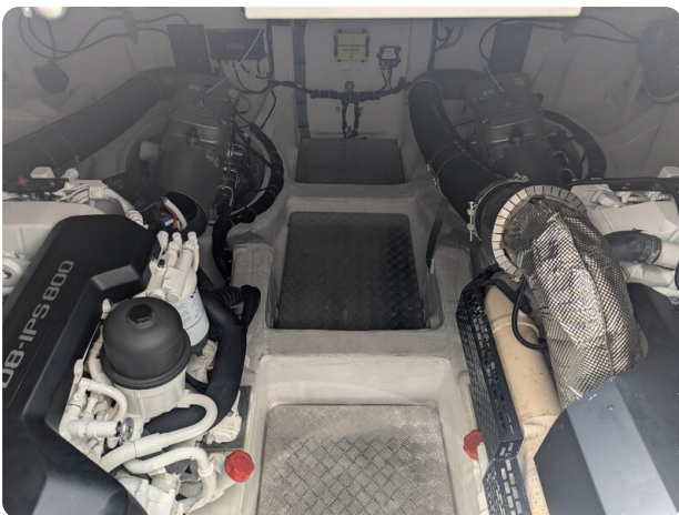
{1} Engine room