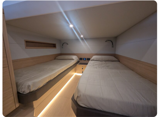
{1} Guest cabin