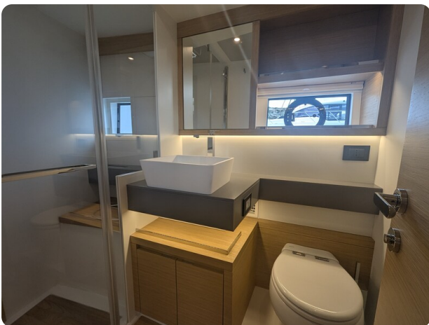
Pardo GT52 guest bathroom