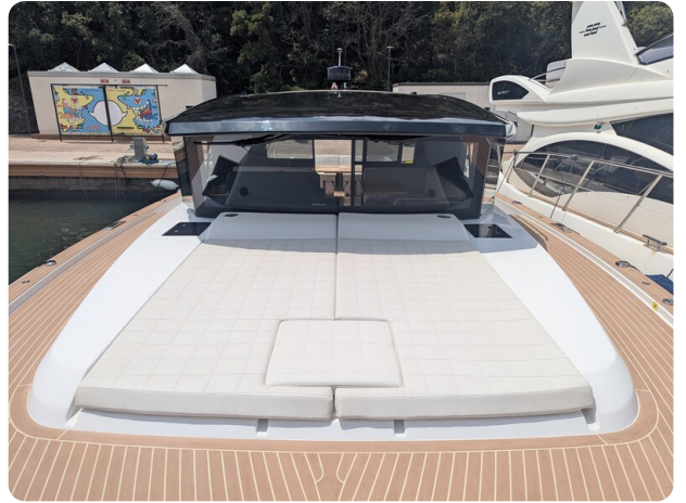
Pardo GT52 fwd deck with sunpad