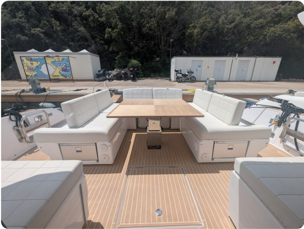
Pardo GT52 cockpit dinette convertible