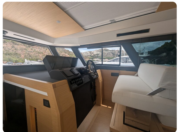
Pardo GT52 helm station