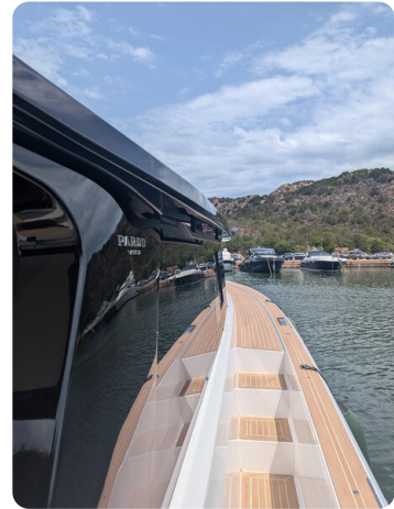
Pardo GT52 sideway