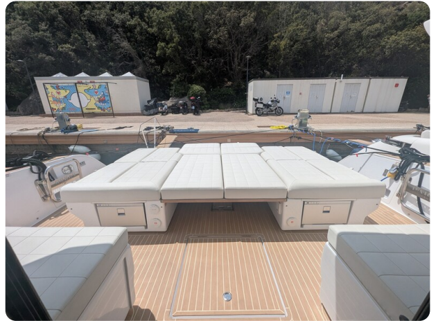
Pardo GT52 aft sunpad