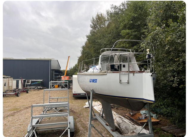
Grinde msp 790164 32