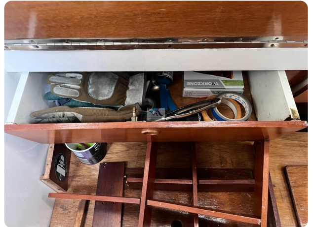
Grinde msp 790164 49