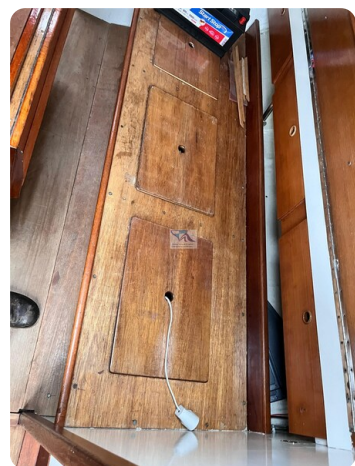
Grinde msp 790164 33