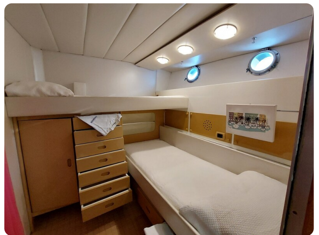
Picchiotti 68, Cabanon, cabina ospiti 2