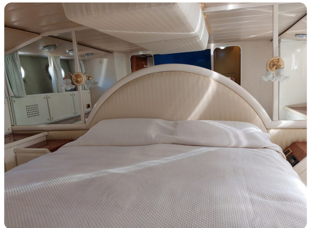
Picchiotti 68, Cabanon, cabina armatoriale