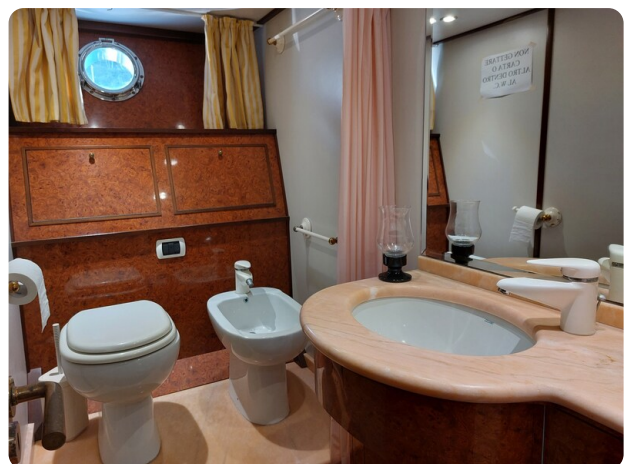
Picchiotti 68, Cabanon, wc cabina ospiti 2