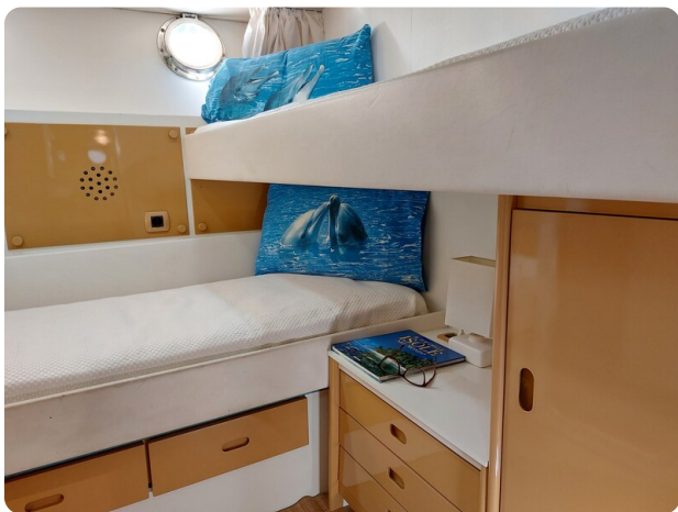
Picchiotti 68, Cabanon, cabina ospiti 1