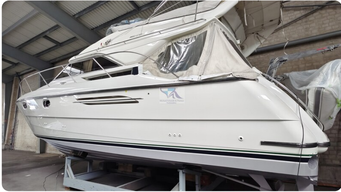
Princess 420 ARNO 37