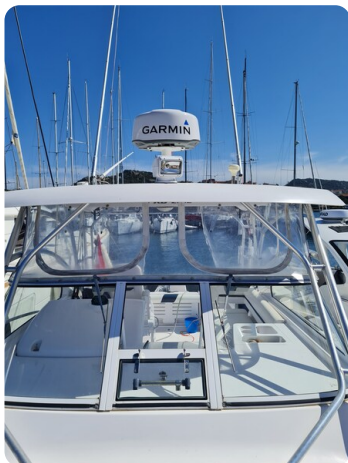
Proline 32 Express, Hard Top detail