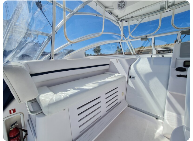
Proline 32 Express, cockpit lounge