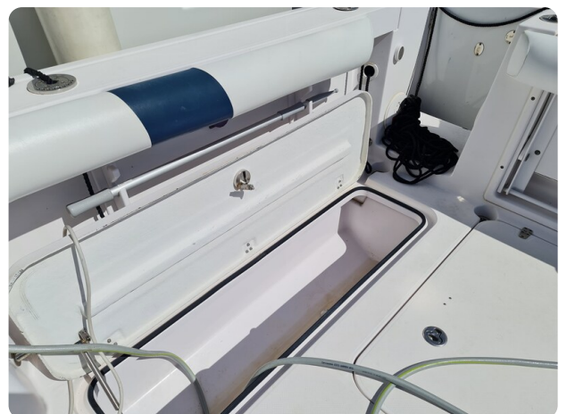
Proline 32 Express, fish box