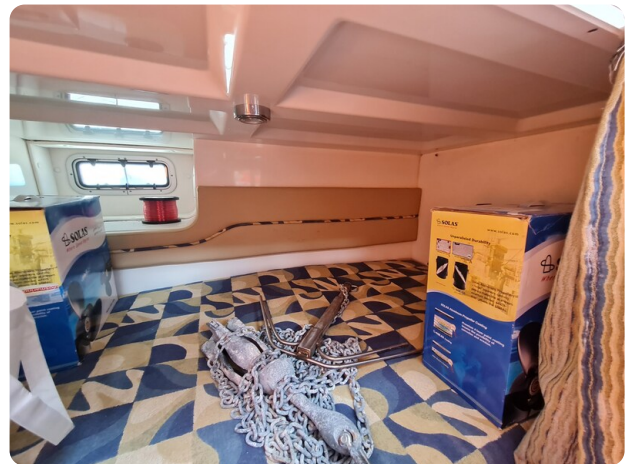
Proline 32 Express, aft cabin