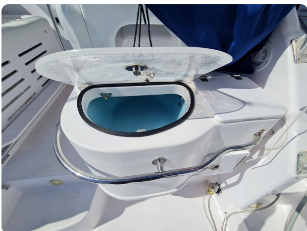
Proline 32 Express, live baitwell