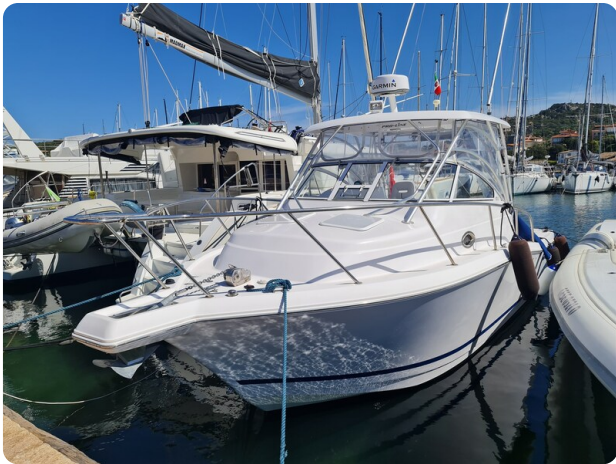
Proline 32 Express, bow view