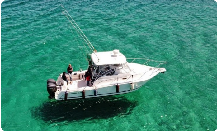
Proline 32 Express aerial view