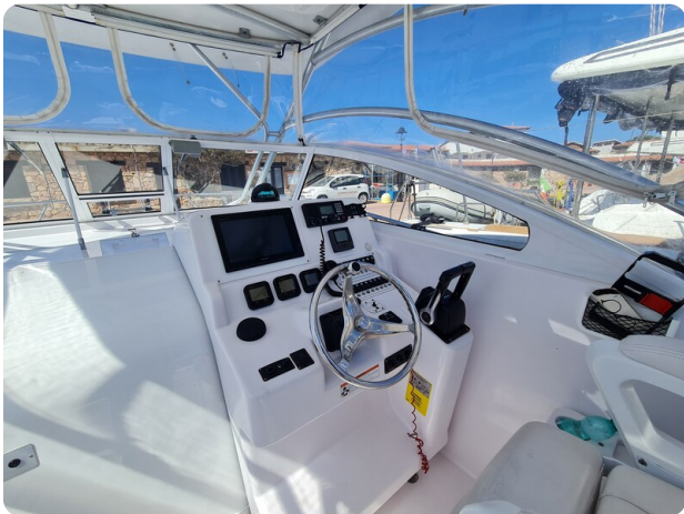
Proline 32 Express, helm station