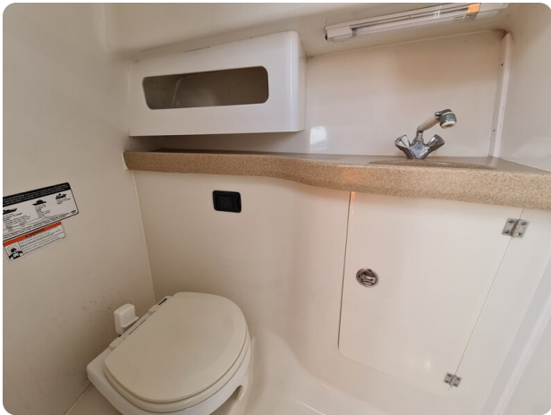
Proline 32 Express head view