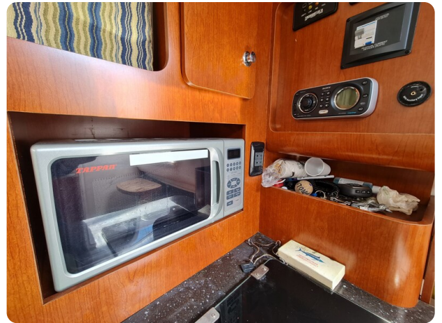
Proline 32 Express, microwave