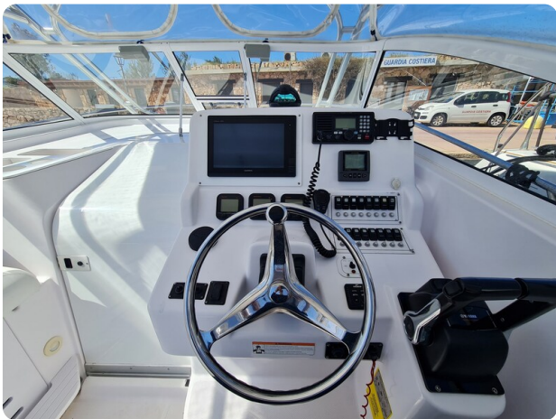
Proline 32 Express, helm