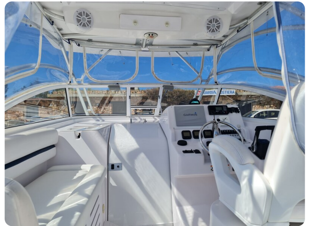
Proline 32 Express, upper cockpit