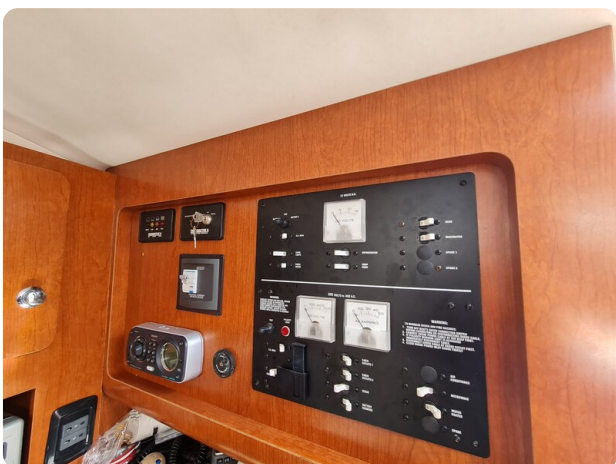
Proline 32 Express, electric panel