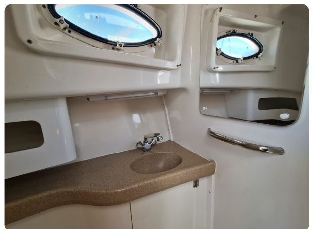
Proline 32 Express, bathroom