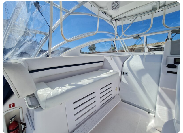
Proline 32 Express, cockpit lounge