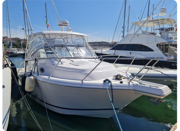
Proline 32 Express, bow profile