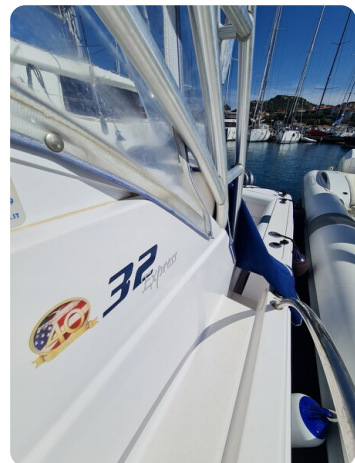
Proline 32 Express, side view