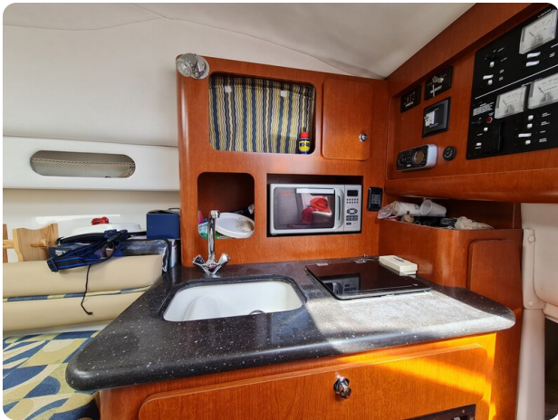
Proline 32 Express, galley