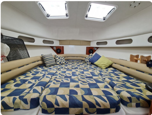
Proline 32 Express, berth