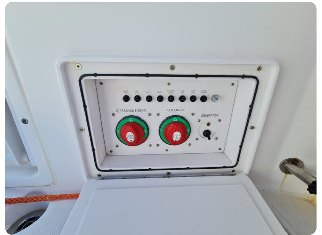
Proline 32 Express, cockpit detail