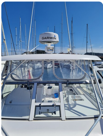
Proline 32 Express, Hard Top detail