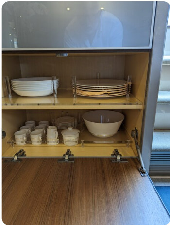
Rivarama Riva details