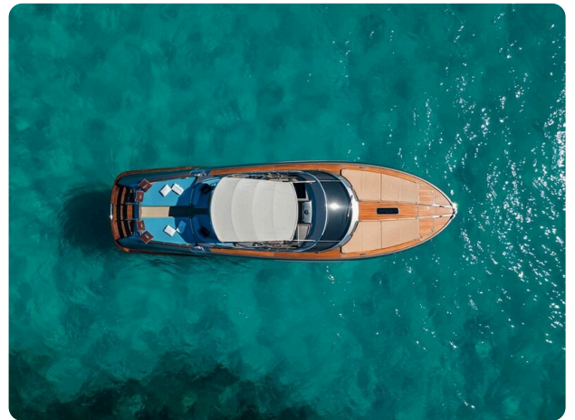
Rivarama Top View