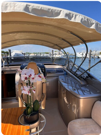
Rivarama cockpit detail